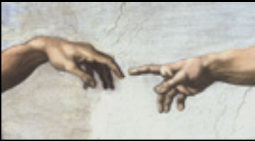
Original: Finger of God. Michelangelo (ca1510)