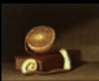
Original: Still Life with Orange and Book. Peale (1815)