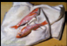
Original: Red Mulletts. Monet (1869)