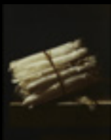
Original: Still Life with Asparagus. Coorte (1697)