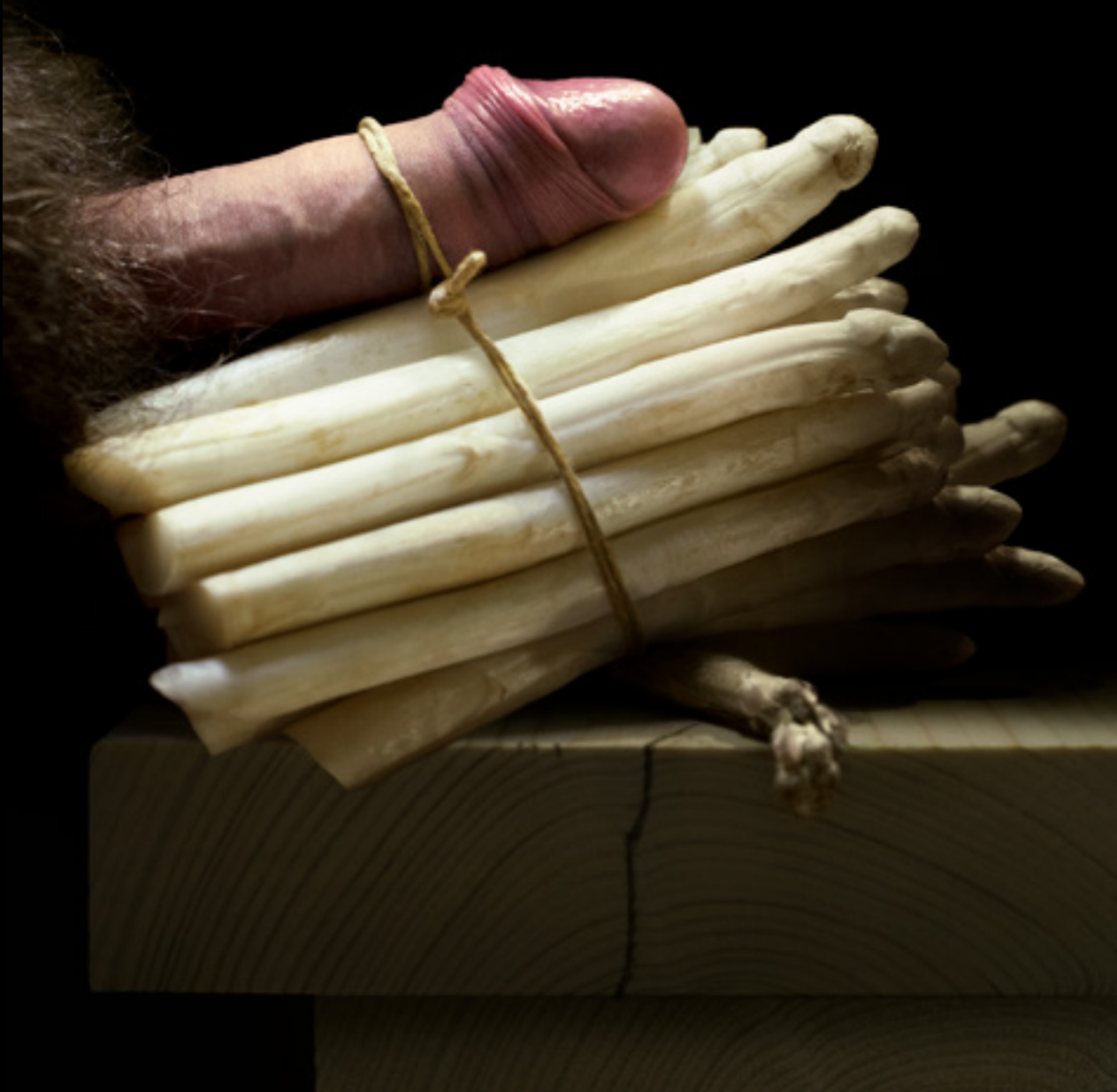
Still Life with Asparagus and Tied Dick. Ubbe (2017)