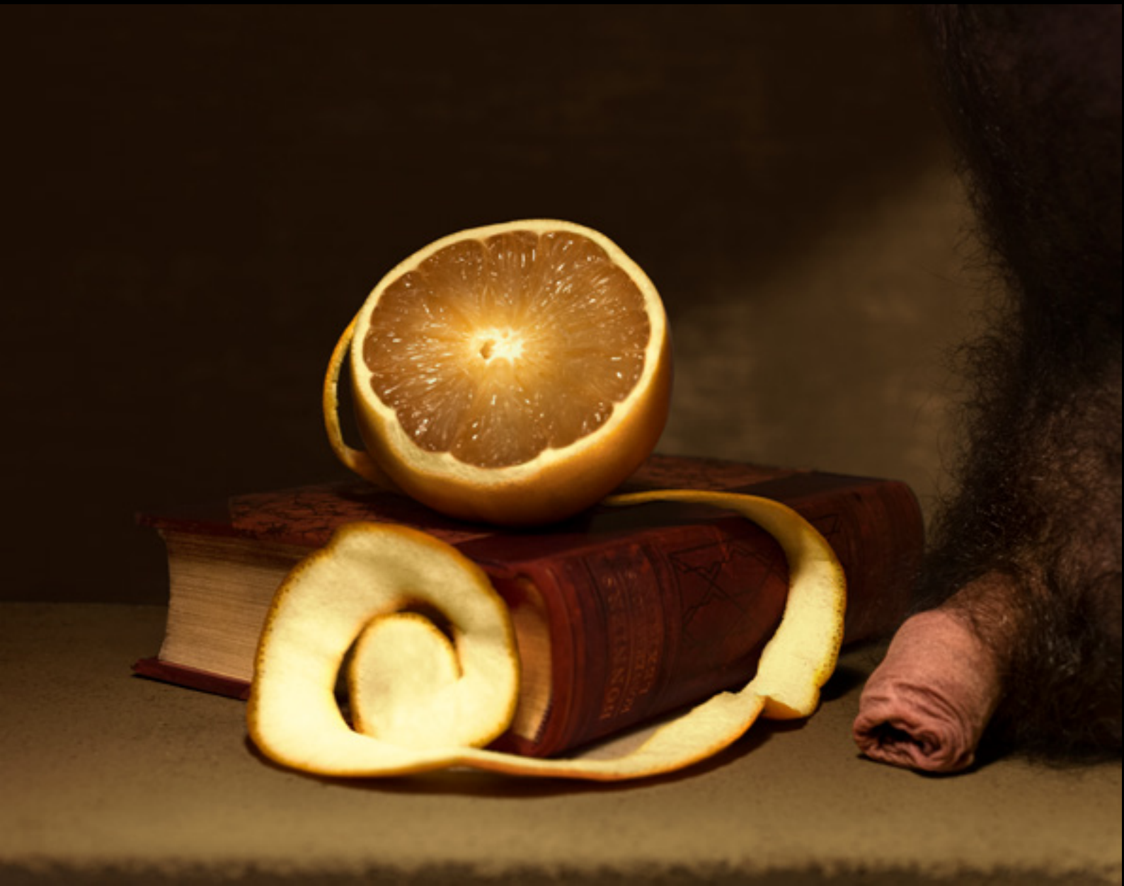
Still Life with Orange and Book and in Addition... Ubbe (2017)