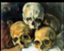
Original: Pyramid of Skulls. Cézanne (1901)