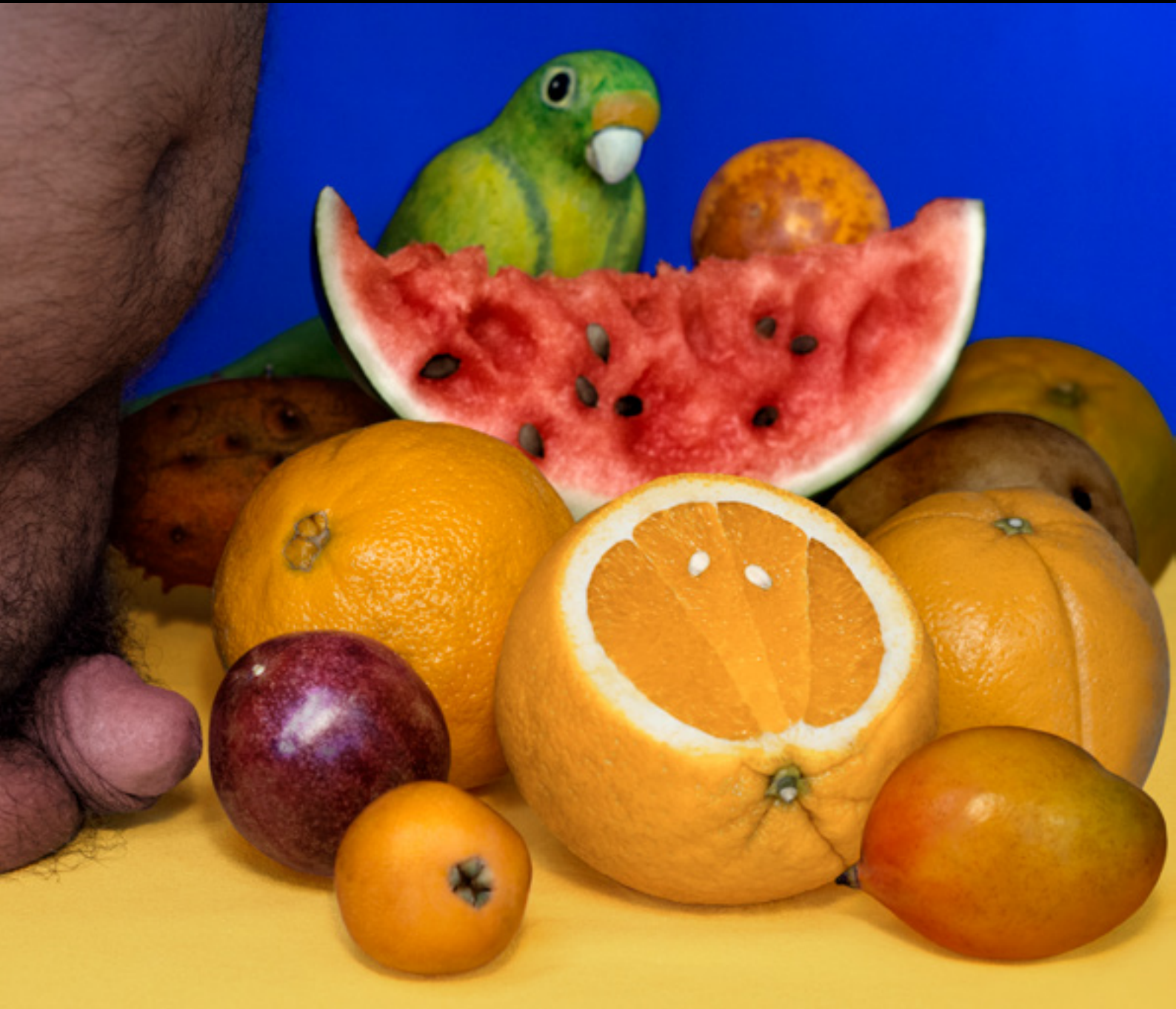
Still Life with Parrot and Fruit and Dick. Ubbe (2017)