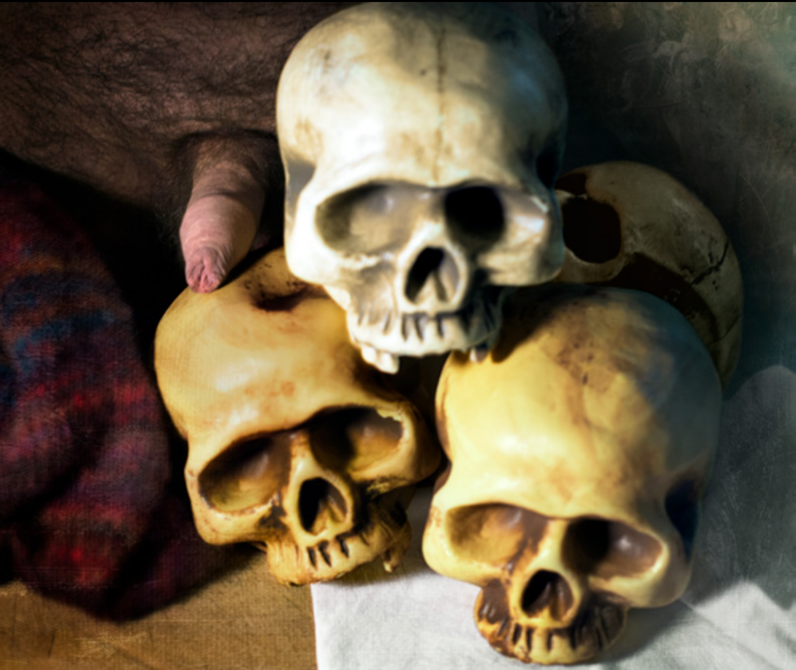
Pyramid of Skulls with Accessory. Ubbe (2017)