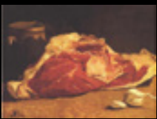
Original: Still Life with Flesh. Monet (1864)