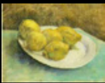
Original: Lemons on a Plate. Van Gogh (1887)