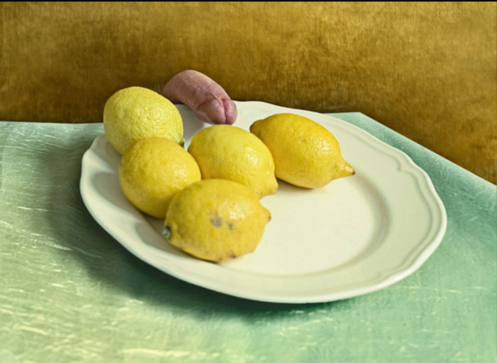
Curious Dick among Lemons on a Plate. Ubbe (2017)