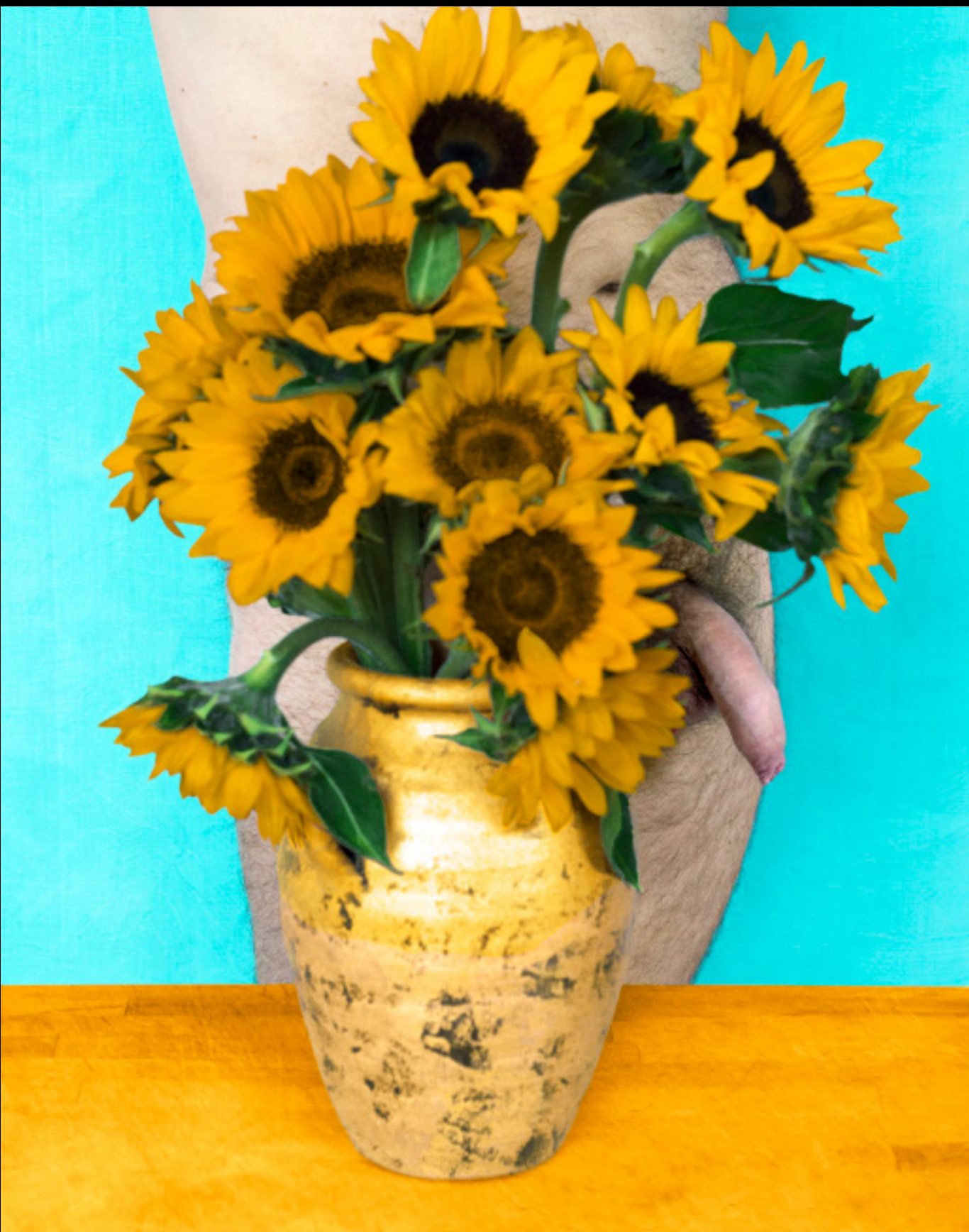
Sunflowers Hideout. Ubbe (2017)