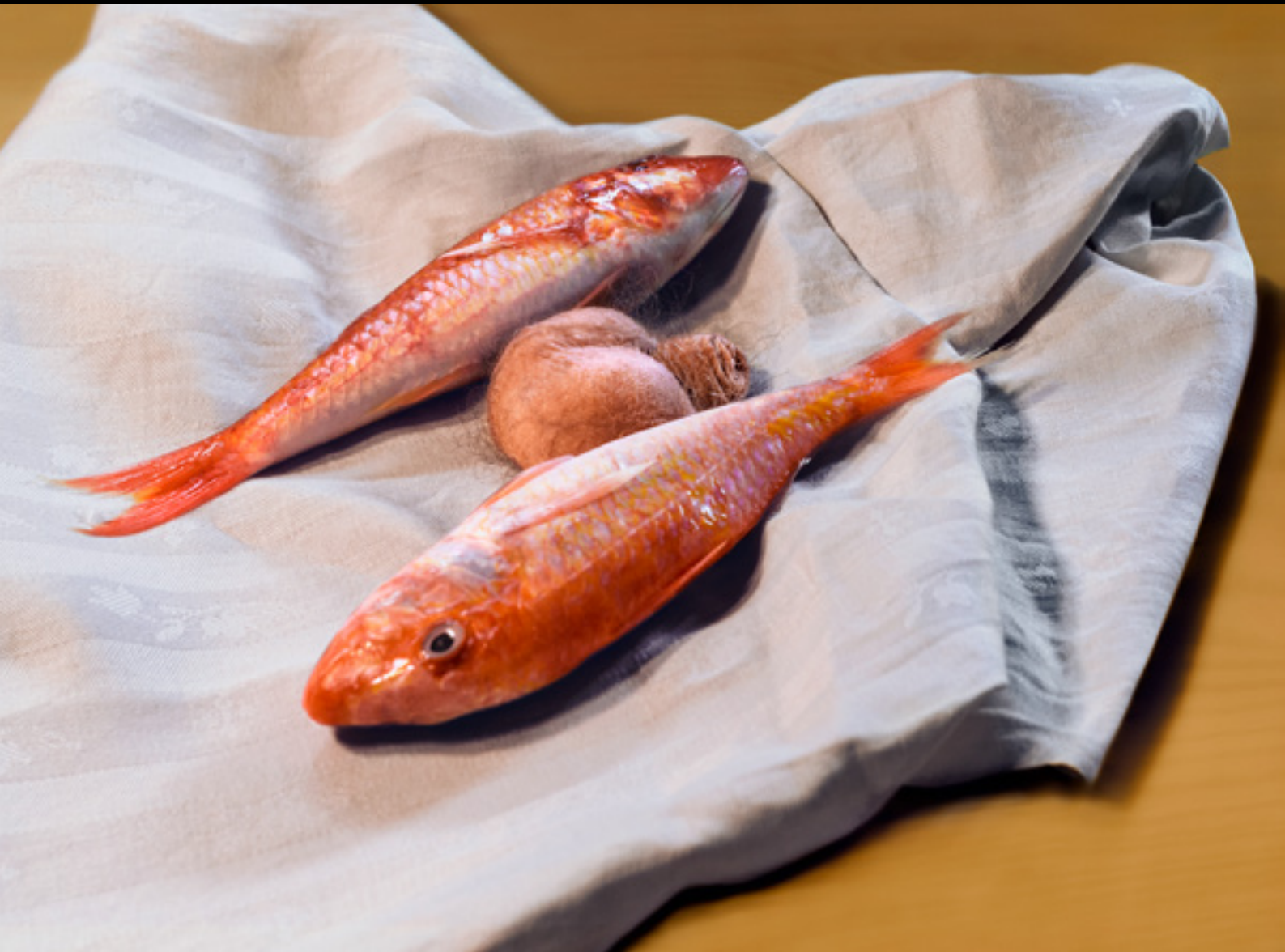
Red Mulletts and Surprise. Ubbe (2017)