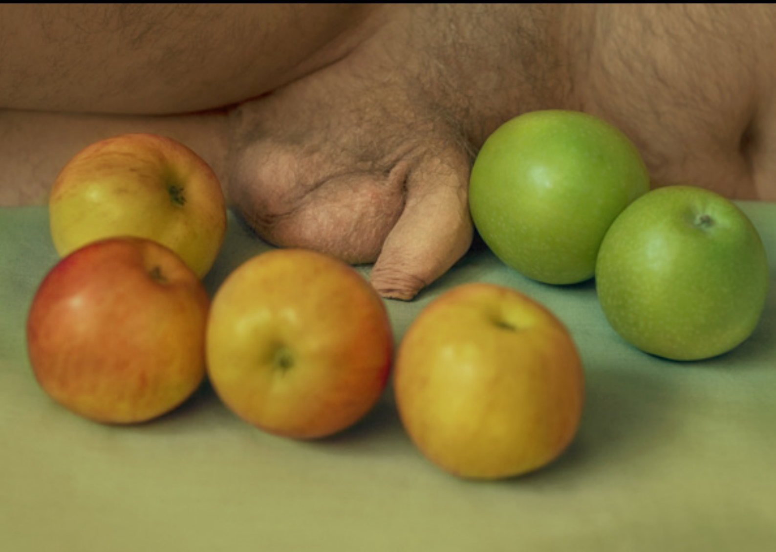
Still Life with Apples and resting Dick. Ubbe (2017)