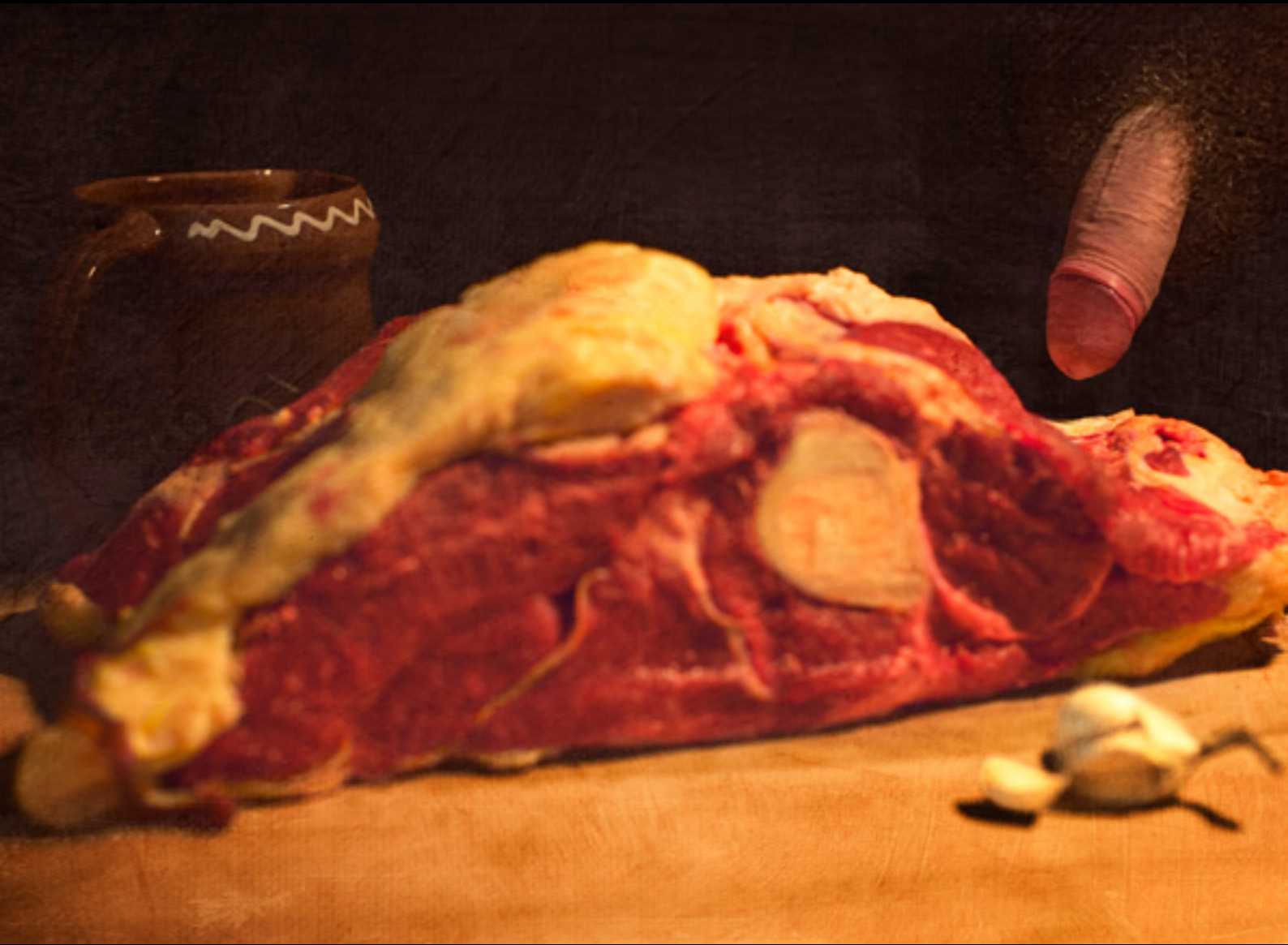
Still Life with Flesh and Dick. Ubbe (2017)