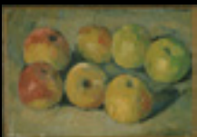
Original: Still Life with Apples. Cézanne(1877)