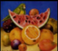
Original: Still Life with Parrot and Fruit. Kahlo (1951)