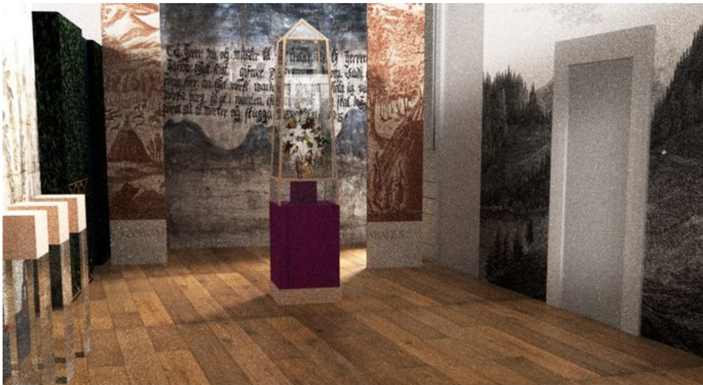
Del av 3D-skiss, obelisk.