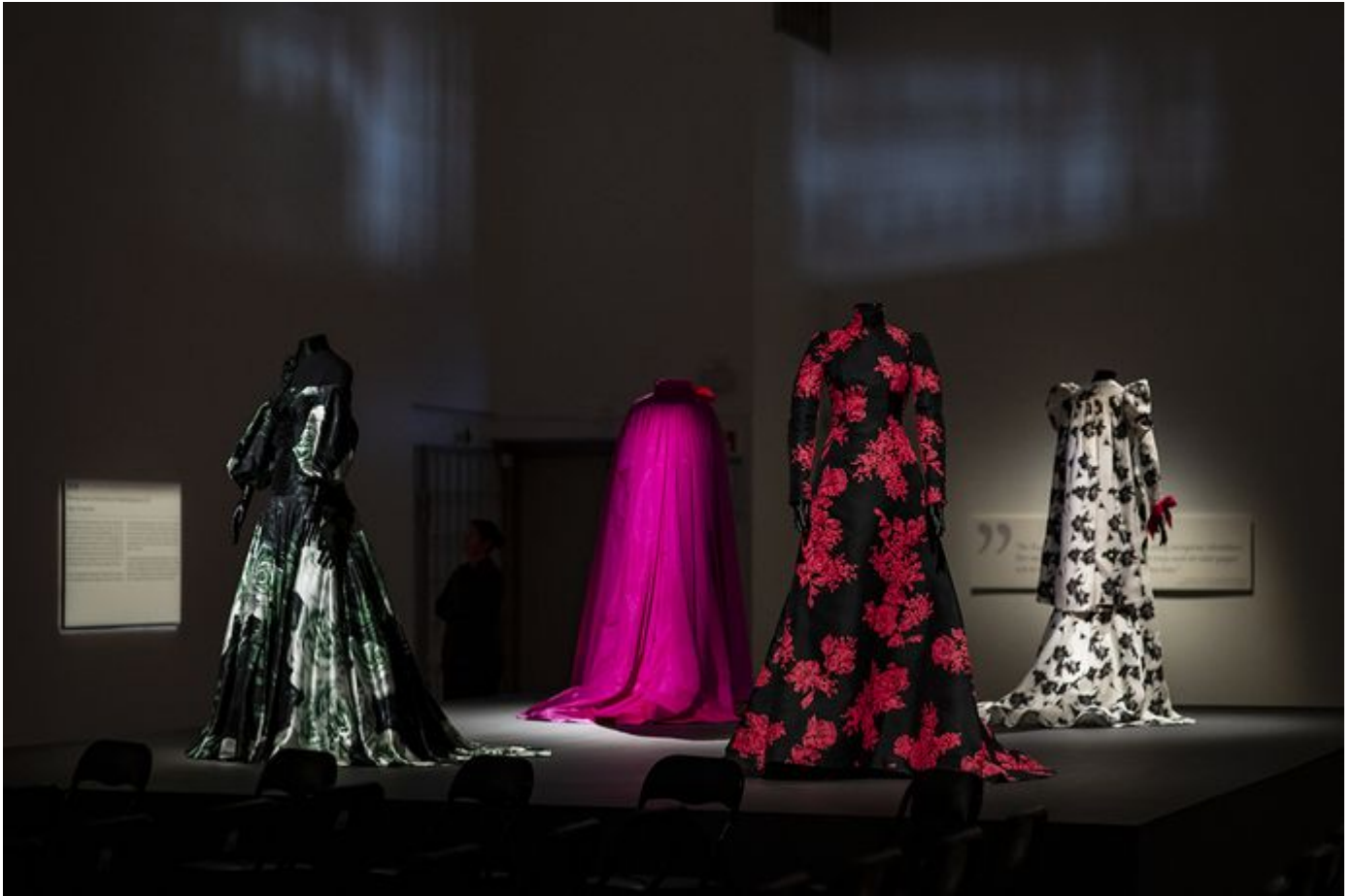
Evigt stolt i eget ljus - Sara Danius och modet.