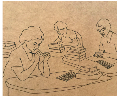
Illustrationer, tryckta på MDF och plywood, är återkommande i utställningen. Illustratör: Christina Heitmann.