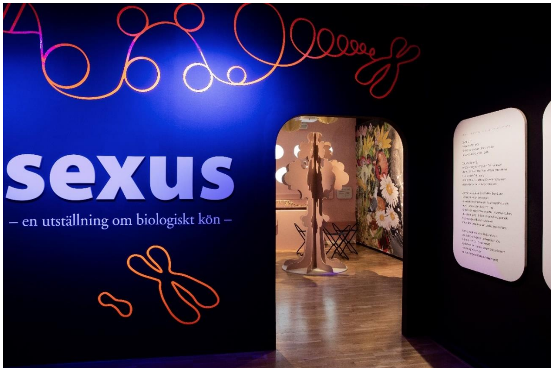
Entrén till Sexus.