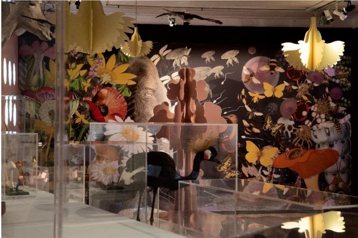
Med eller utan kön.