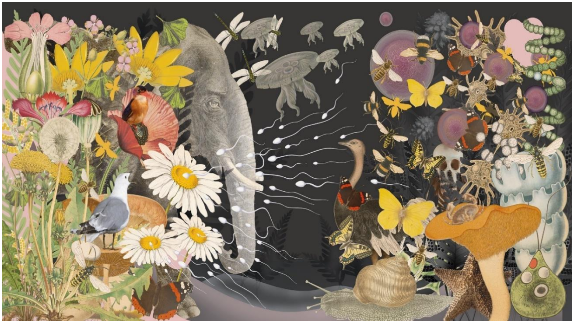
Collaget är gjort av detaljer från vår samling av skolplanscher. Illustration © Astrid von Heideken/Expology AB