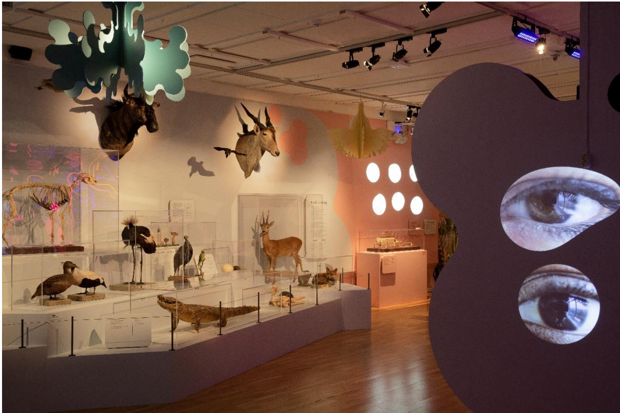
Människan och mänsklig variation gestaltas med filmprojektioner av ögon.

människan och användas som ingång till ett samtal om kön sett ur olika perspektiv - biologiskt så väl som socialt och juridiskt.