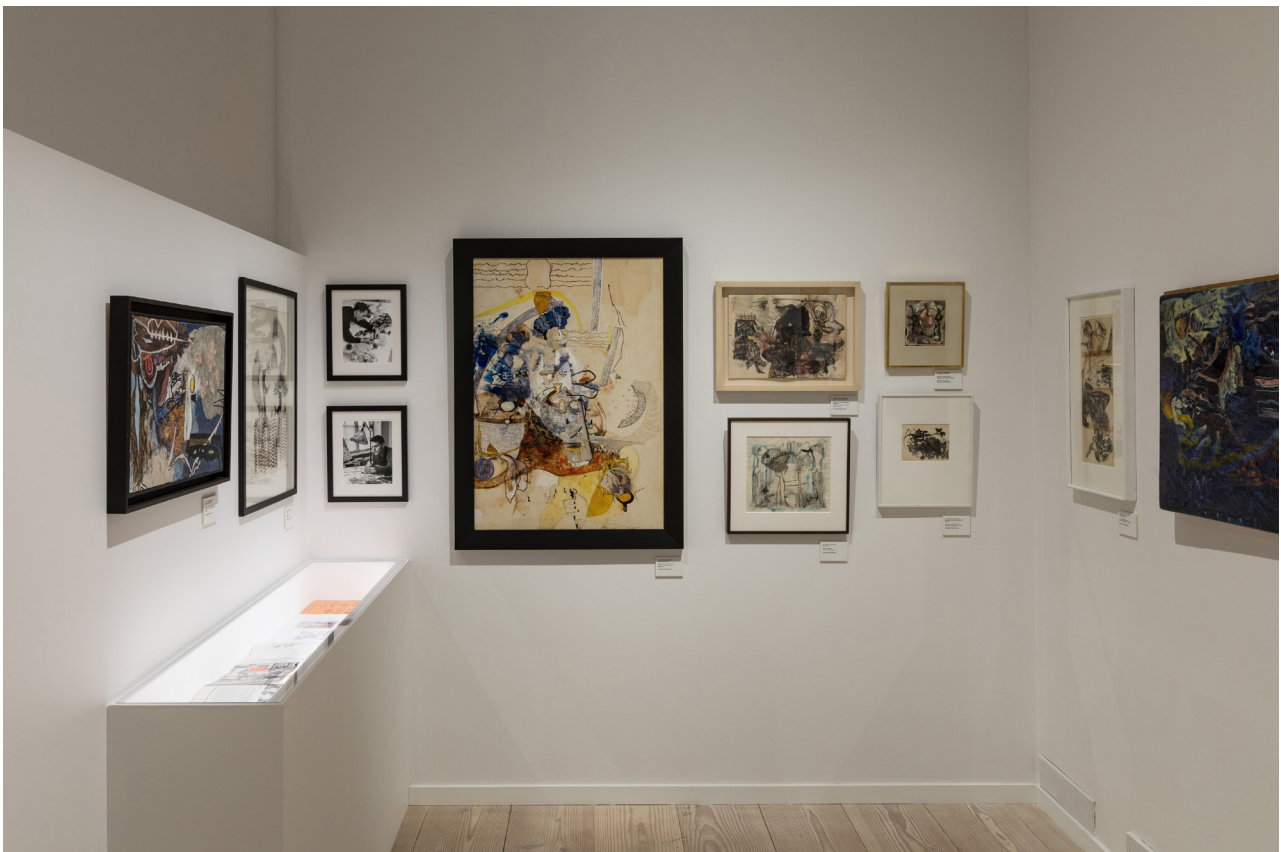
Utställningsvy med Thea Ekström och Öyvind Fahlström