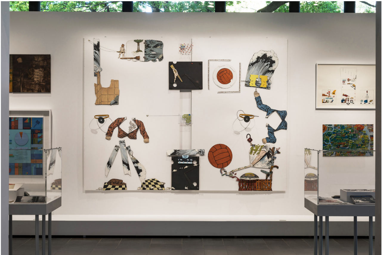
Utställningsvy med Öyvins Fahlströms Cold War