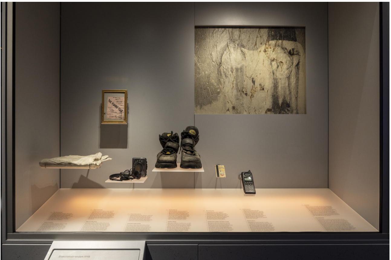
Föremål från Diskoteksbranden 1998 visas i en avskild del, med en film gjord av Roozbeh Behtaji.