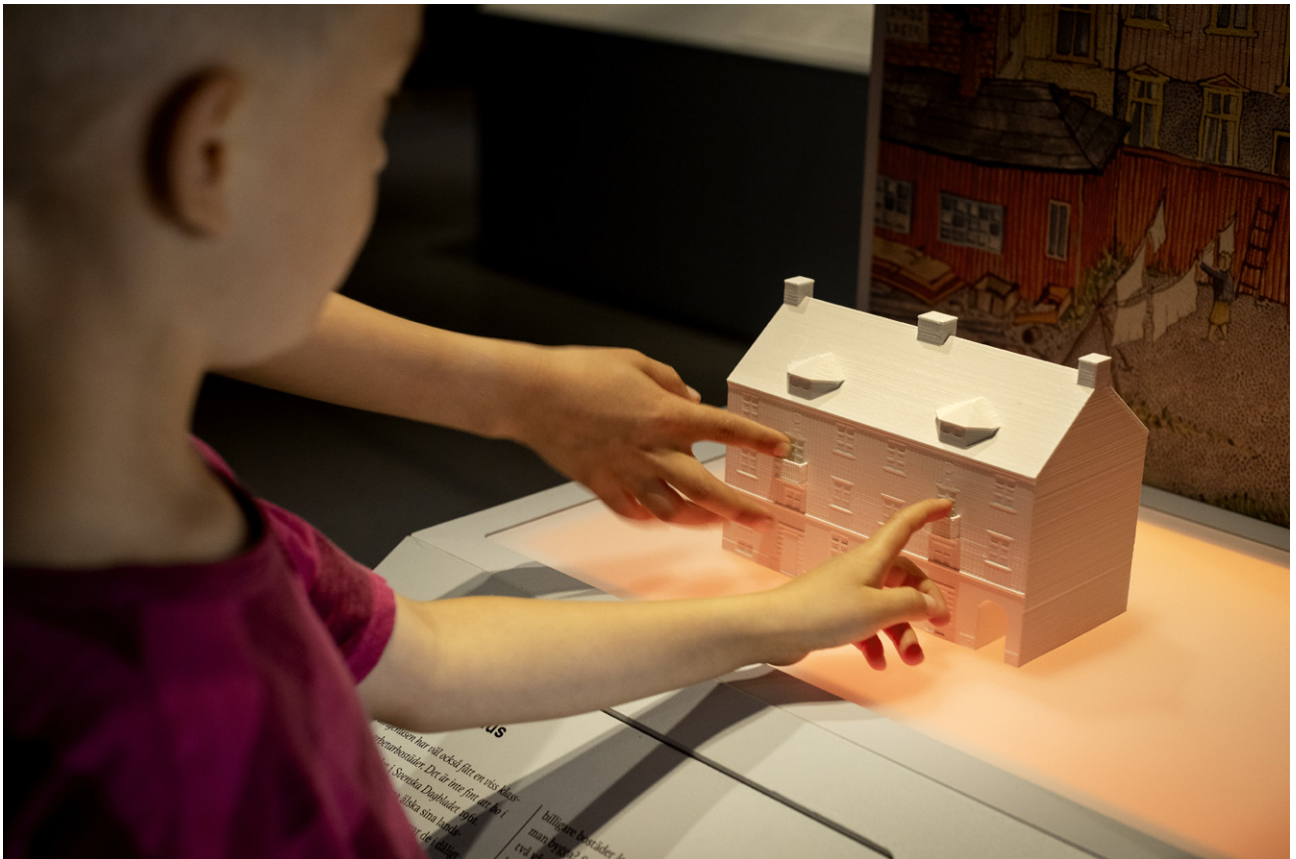
Referensgrupperna pratade mycket om byggnader, 13 sådana valdes ut och 3D-printades till kännbara kopior.