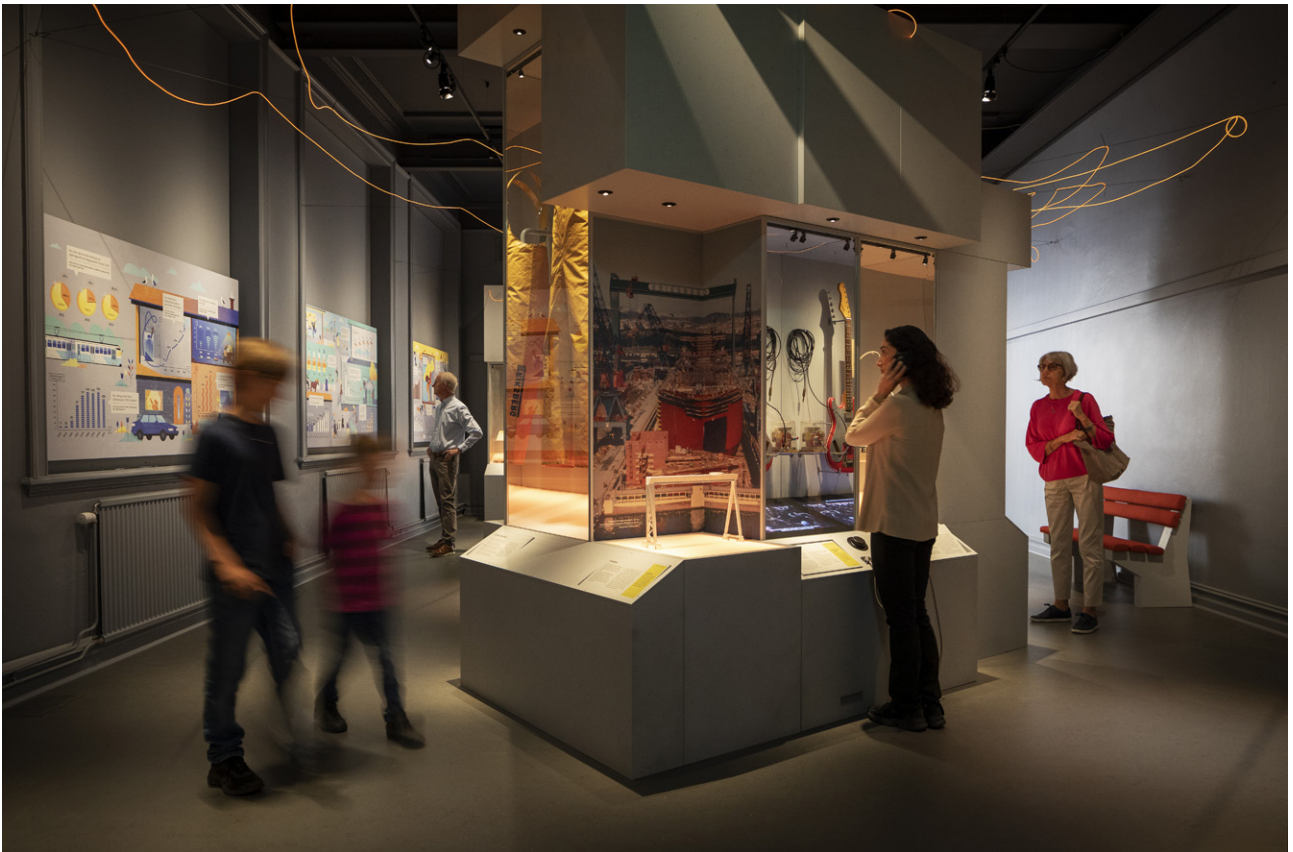
Föremålen sätts i fokus med separata montrar, som bildar kluster. Montrarnas form har en känsla av brutalistisk betong.