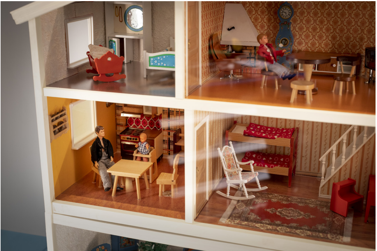
Ett av flera nyförvärv, Lundby dockhus från 1981.