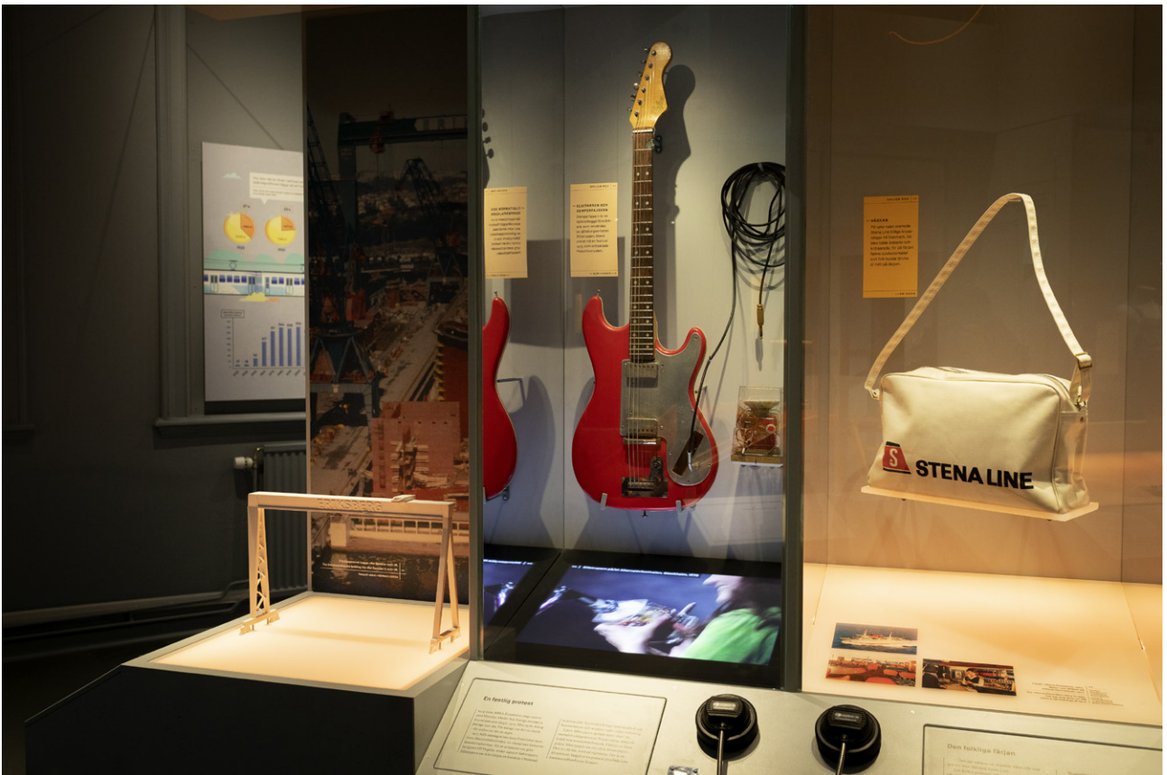
Texter på svenska och engelska finns på vändbara skivor.