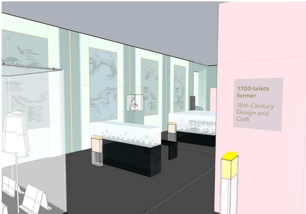
Skiss, placering infoskylt och lyftbara föremålsplattor