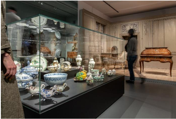
Keramikmonter i förgrunden, i bakgrunden Interiören från Hökälla Säteri, foto: Carl Ander.