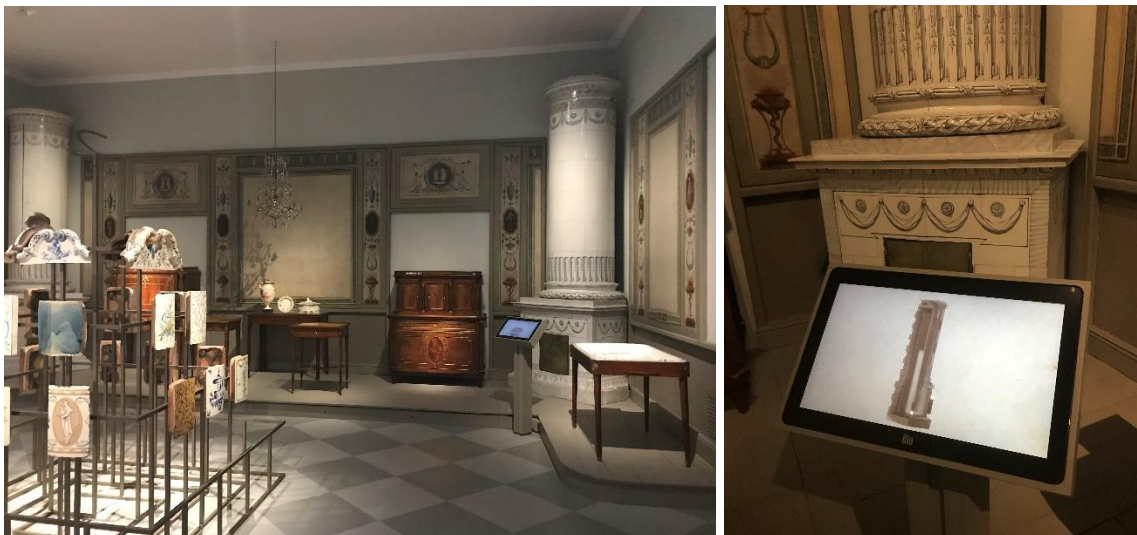
Rum tre, installation av kakelugnsplattor och möbelpodier med kakelugn, närbild på digitalstation om kakelugn