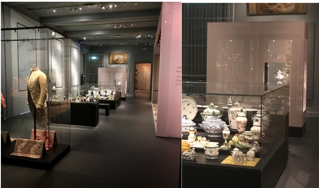
Utställningen sedd från entré via trapphuset på vån 2

Mitt i första rummet finns en autentisk 1700-talsinteriör som också fungerar som en scen för tillfälliga displayer. Först ut är en kommande installation med designlever som skapat nya möbler inspirerade av upplysningstidens idéer.