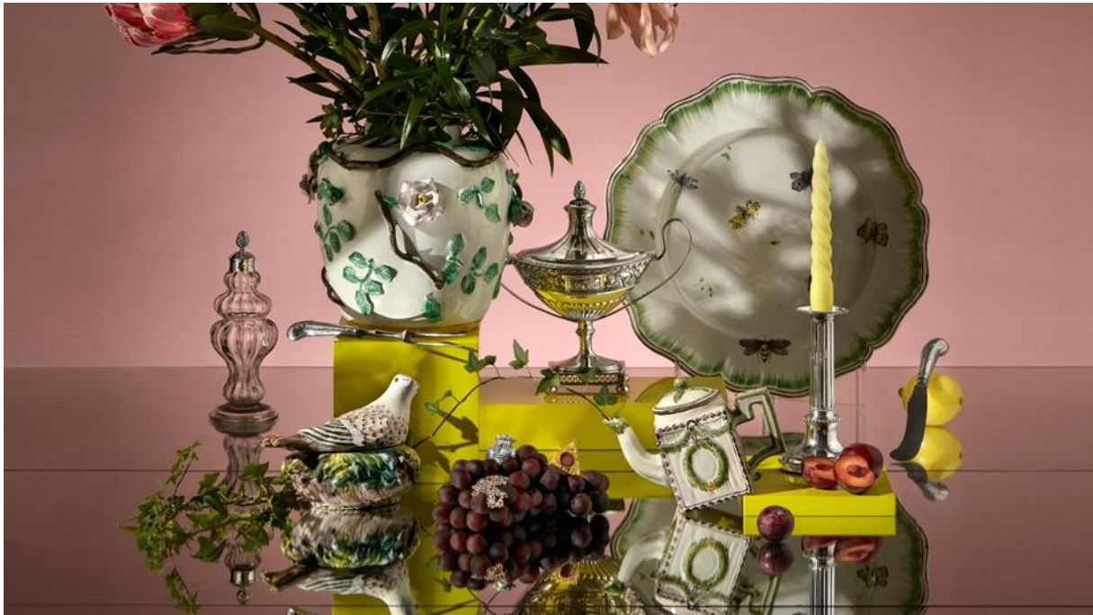
Affischbild, beskuren, styling: Saša Antić Studio, foto: Carl Ander.

Dansande figuriner, sirligt utsmyckade möbeltassar och tidstypiska rumsinteriörer. Röhsska museets nya basutställning 1700-talets former