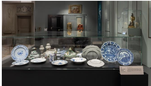
Figurinmonter, modemonter och modeskisser i bakgrunden och Keramikmonter med textplatta i förgrunden som besökaren kan ta upp. Till höger i bild, bordsur med digital fördjupning med olika perspektiv i bakgrunden, foton: Carl Ander.

Museet har arbetat med referensgrupper som ex GIL Göteborg independent living som varit med i processen och testat fysisk tillgänglighet i rummet. Elever från Schillerska gymnasiet har varit med och påverkat val av några föremål och innehållet i kakelugnsstationen, de har även fungerat som bollplank för pedagogiskt innehåll.