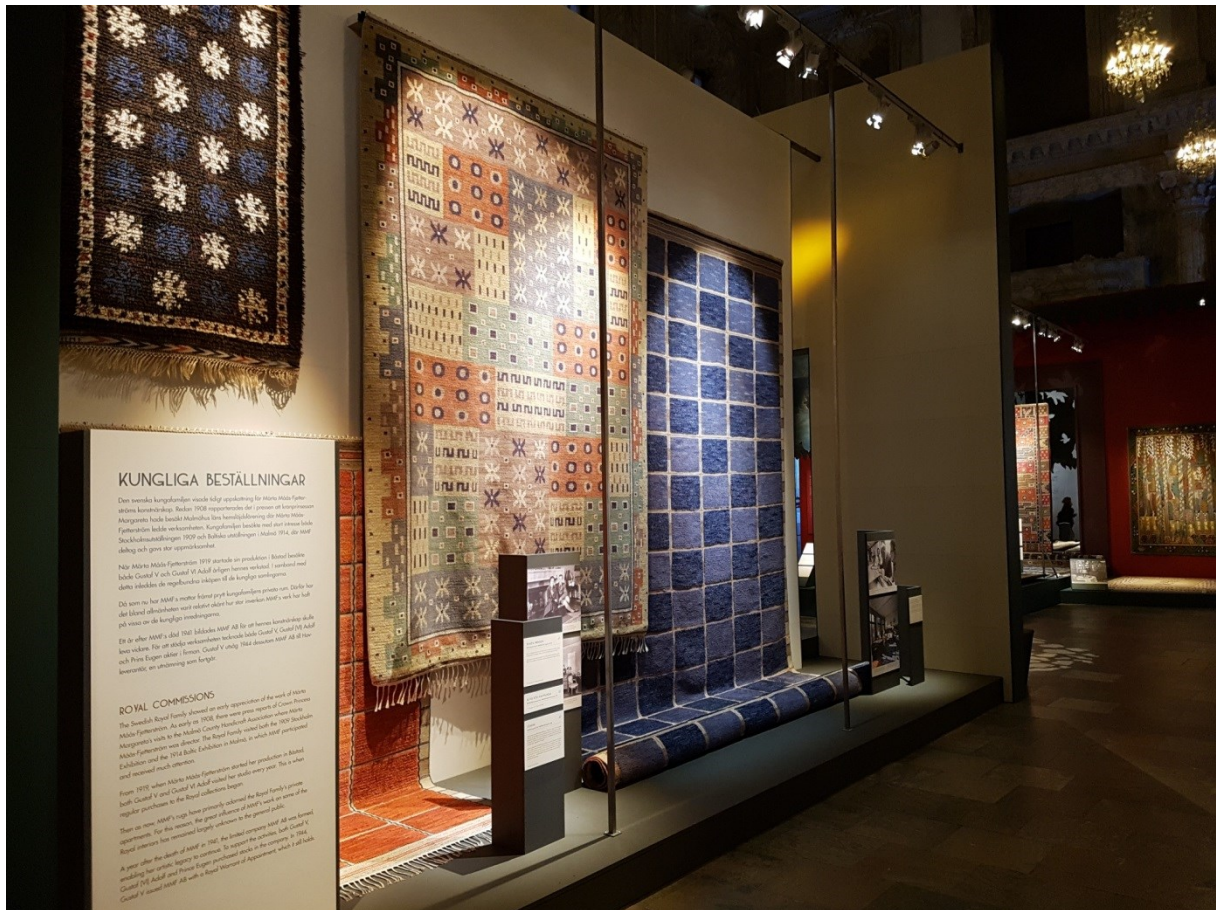
Vägg 2, Flak 2