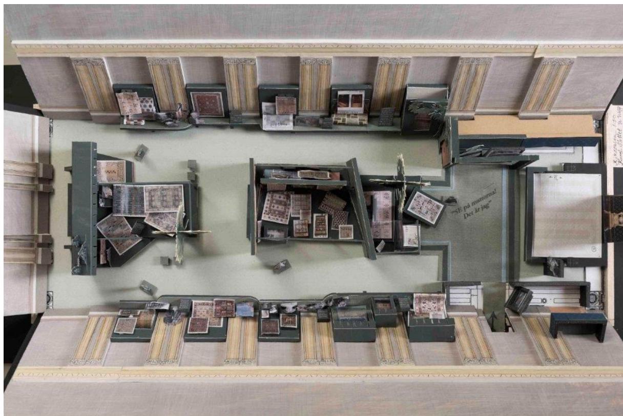
Modell i skala 1:50