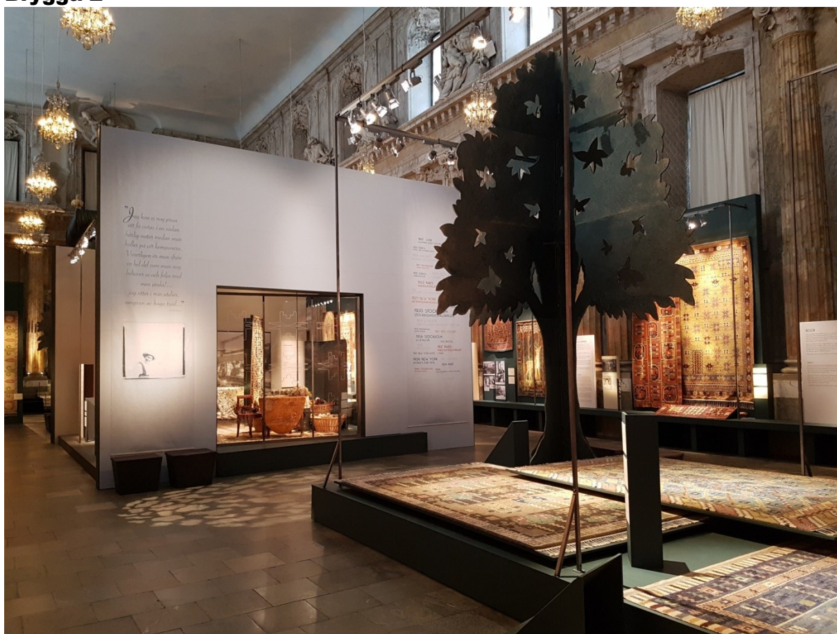
Vägg 3, Brygga 2 till höger i bild