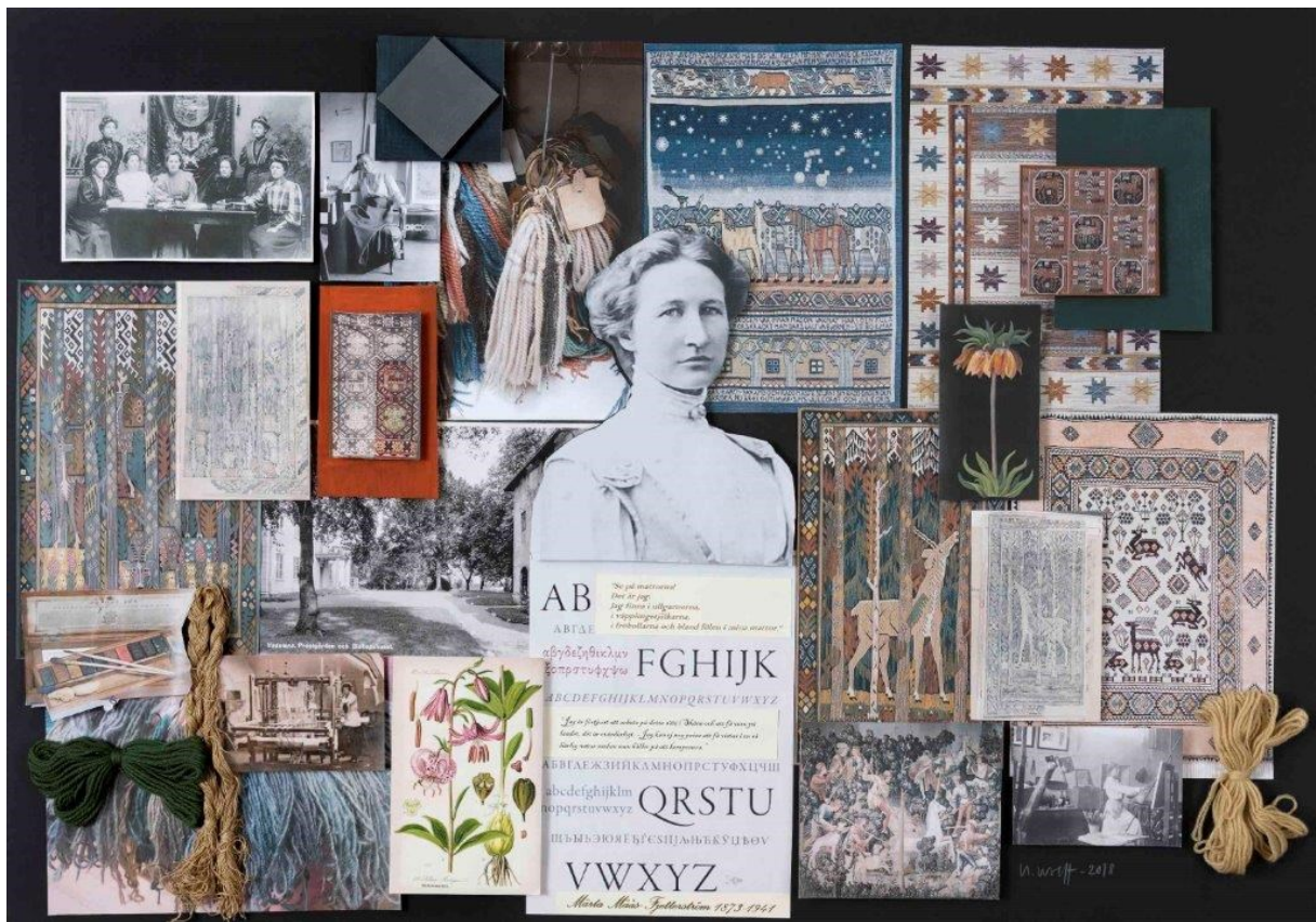
Mood board I