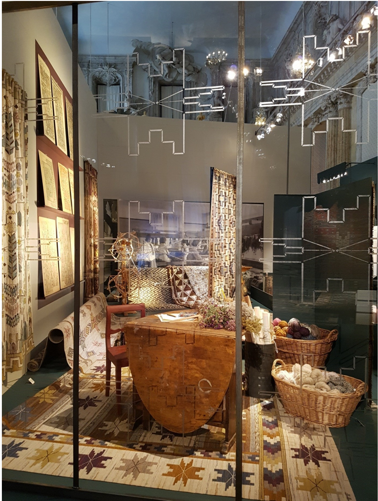
Brygga 1 / Verkstaden