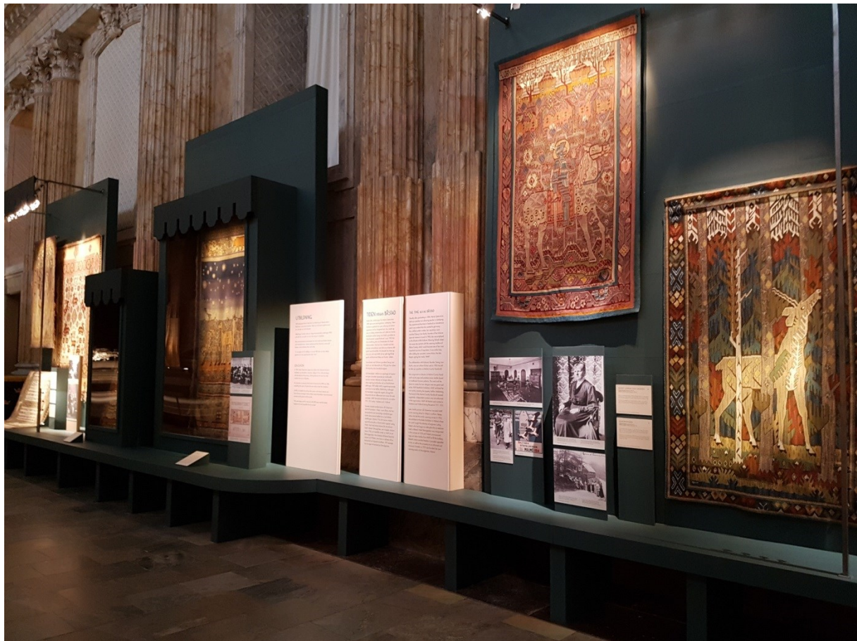
Skärm 1, 2, 3