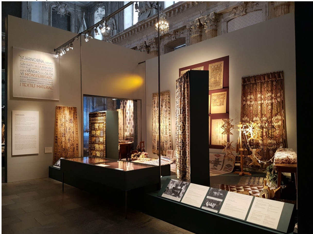
Brygga 1 / Verkstaden