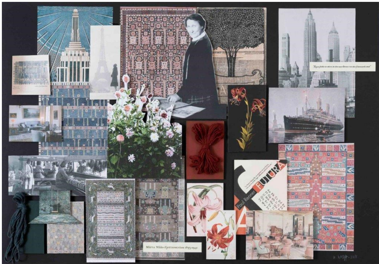
Mood board II