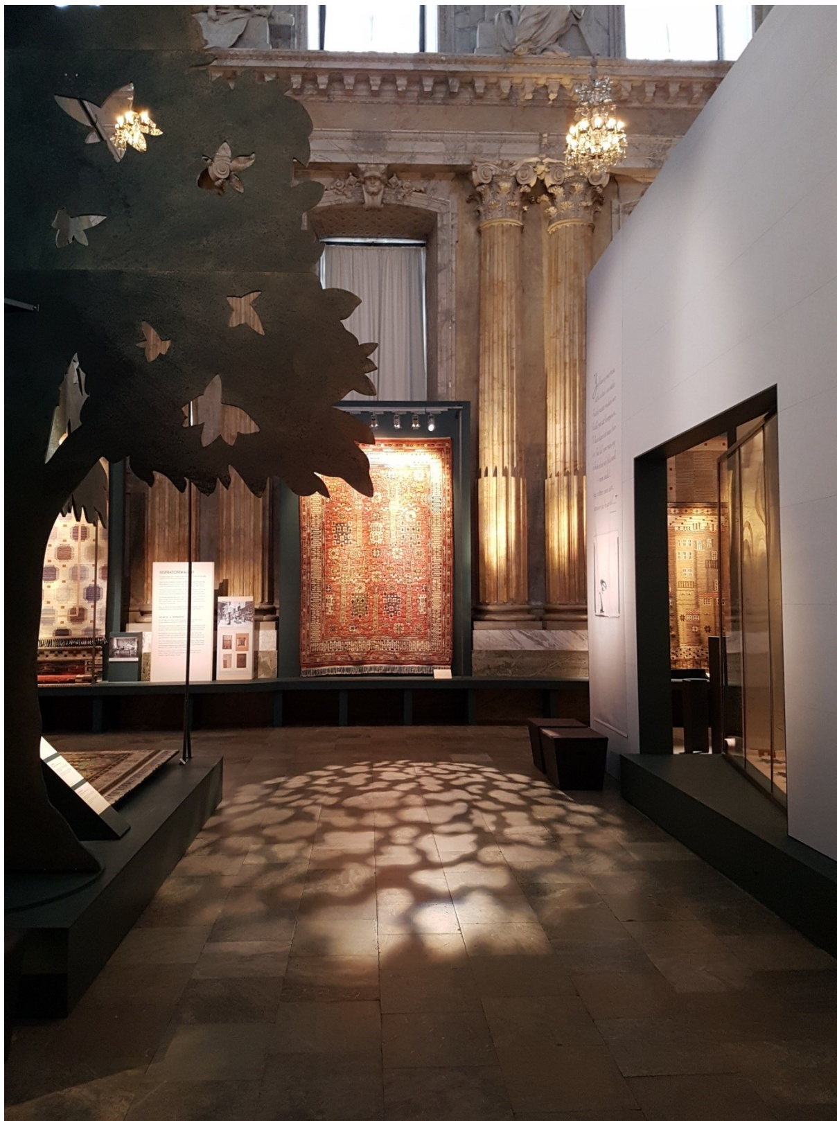
Skärm 8 i fonden