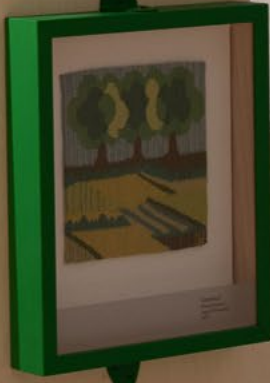
Utställningen är producerad av Jönköpings läns museum 2021 Formgivare: Kicki Rask, Frilansform AB

Äpple Äpple är en av de mest vanliga frukterna i världen. Det är en av de mest älskade frukterna och äpple är en av de mest älskade frukterna i världen. Äpple är en av de mest älskade frukterna i världen. Äpple är en av de mest älskade frukterna i världen.