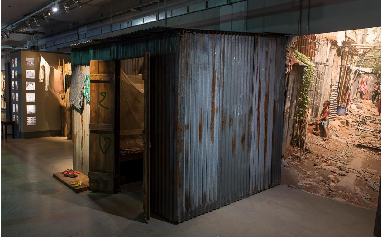
Bostad från Bangladesh