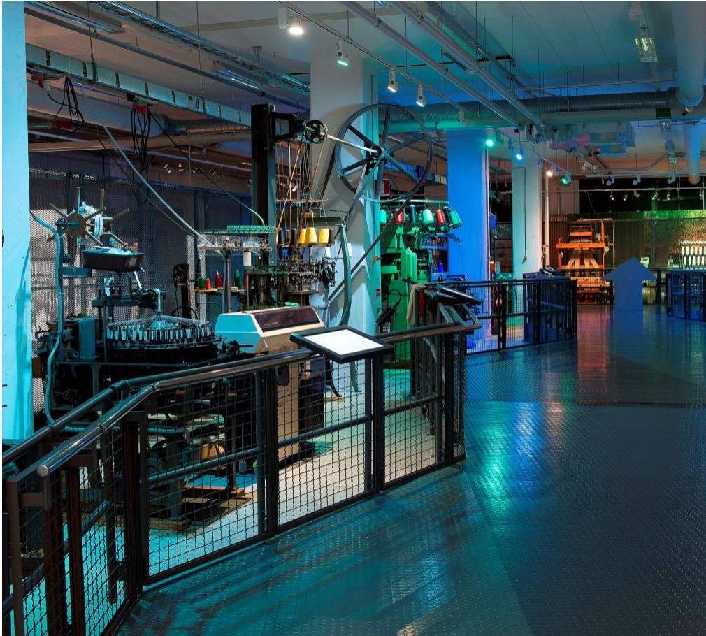
Processen med maskinerna