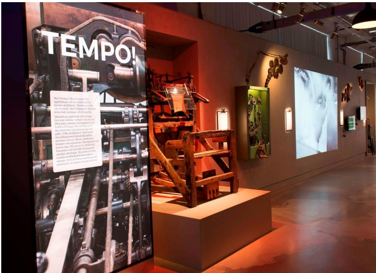
Kraft & teknik