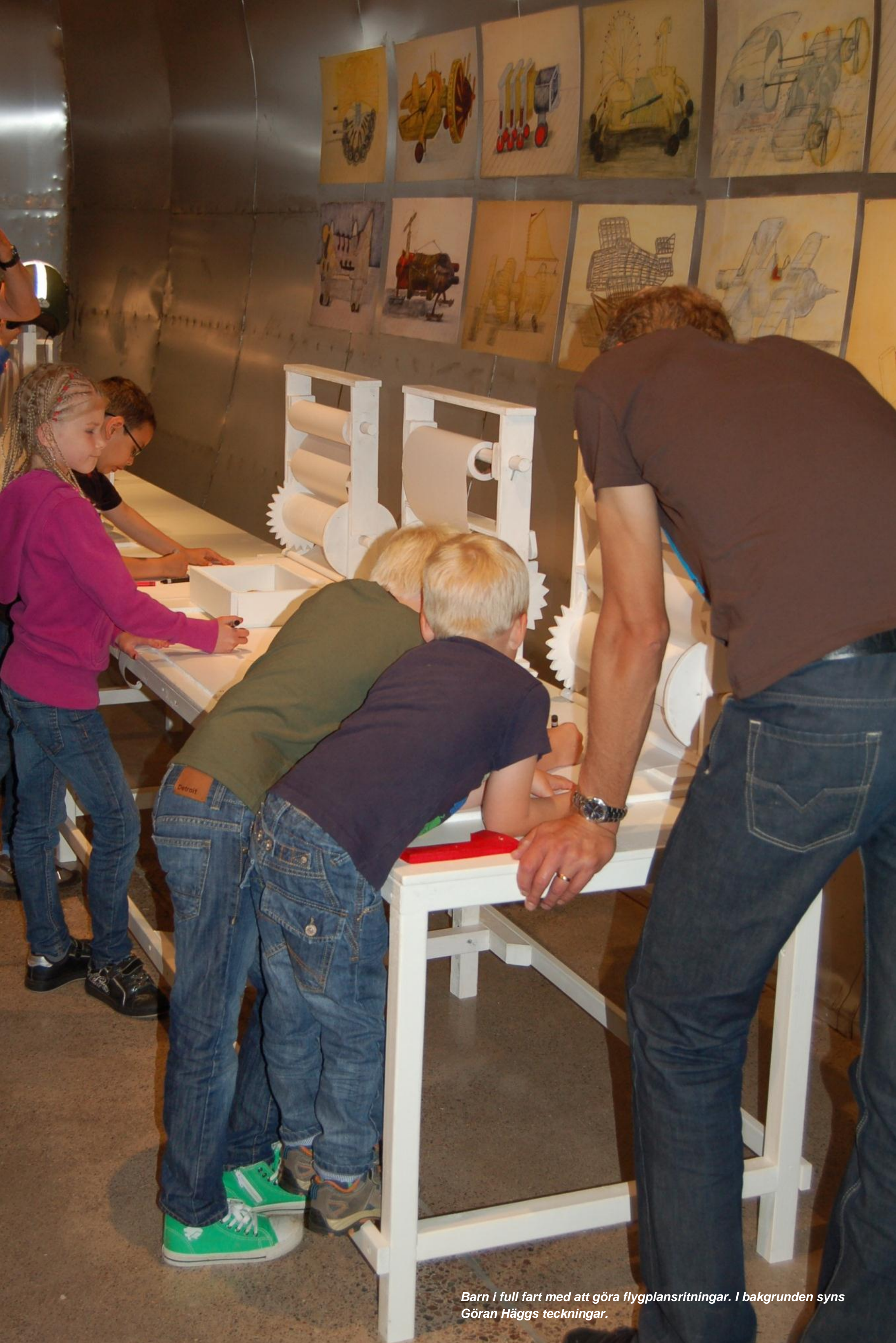
Barn i full fart med att göra flygplansritningar. I bakgrunden syns Göran Häggs teckningar.