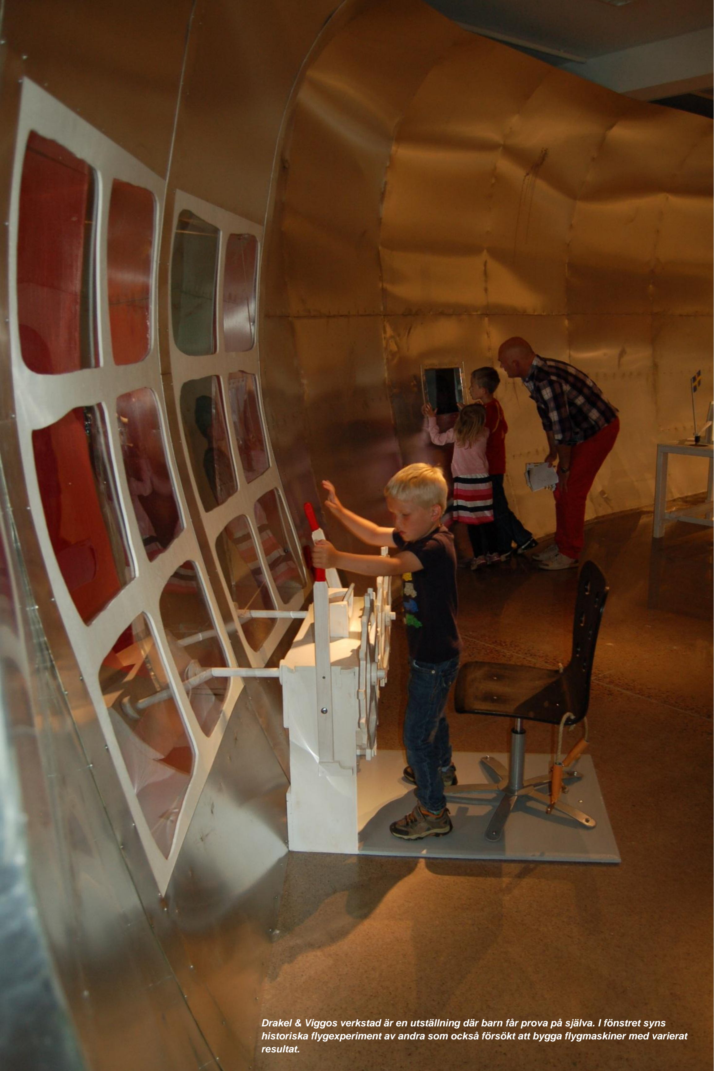
Drakel & Viggos verkstad är en utställning där barn får prova på själva. I fönstret syns historiska flygexperiment av andra som också försökt att bygga flygmaskiner med varierat resultat.