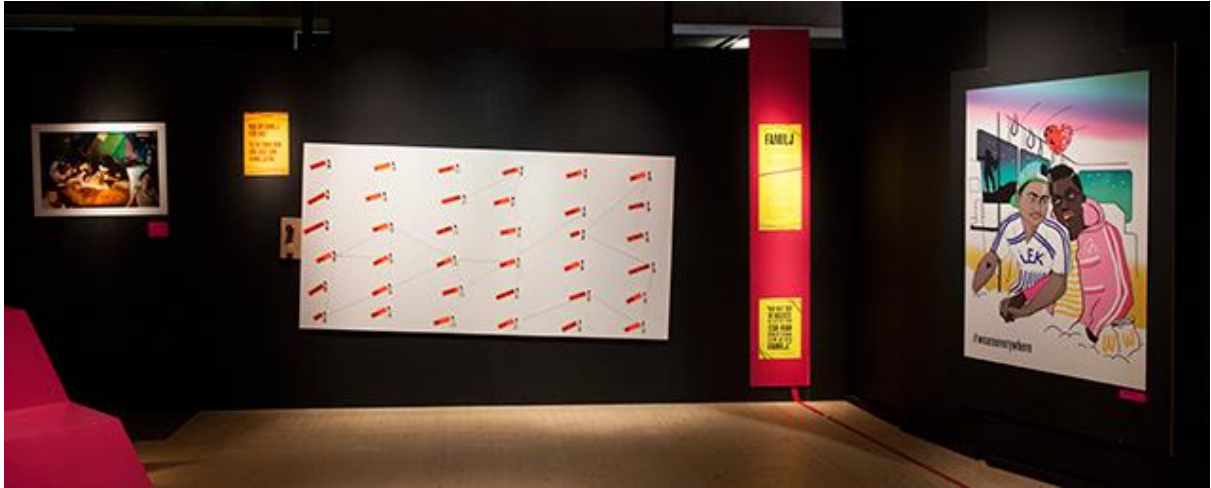
Väv din familjeväv!