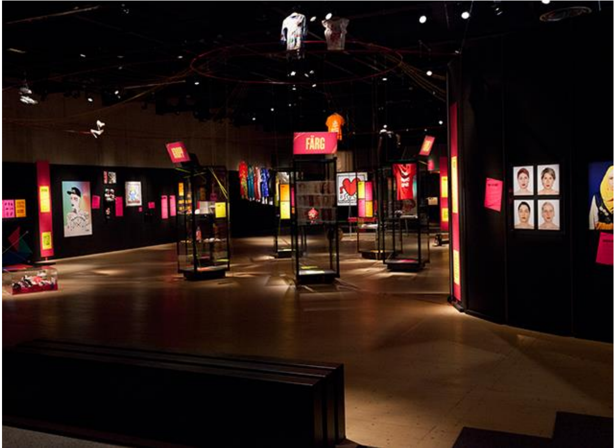
Teman med "unstraighta" föremål och berättelser insamlade i Göteborg.