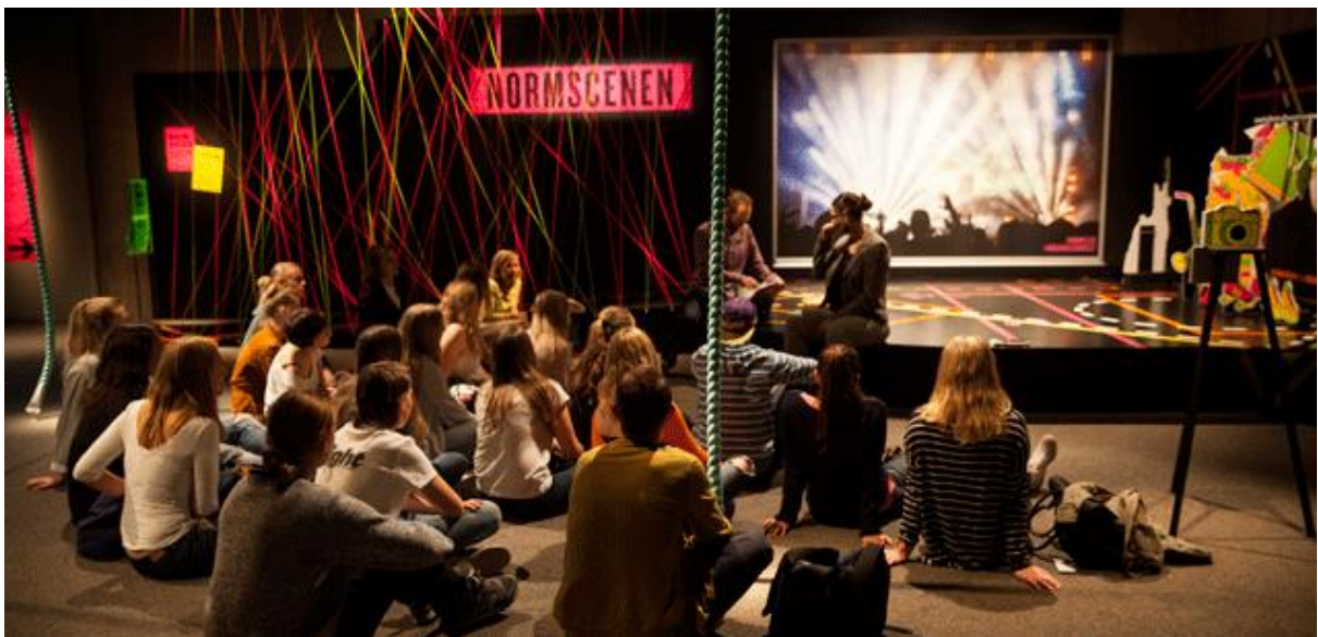
Skolprogram i utställningen