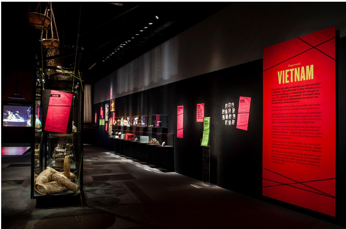
Föremål från museets Vietnamsamling.