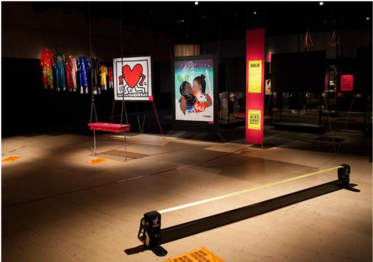
Balansera på statuslinjen! Testa kärleksgungan!