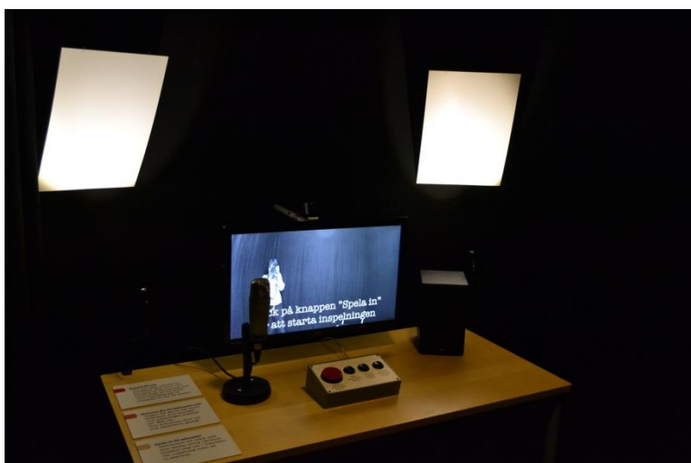
Studio för videoblogg/inspelningar