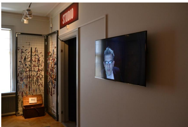
Monitor med 30 sek filmer inspelade i Studio