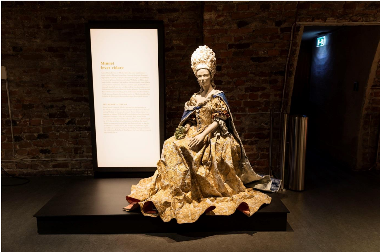
Medicifamiliens kvinnor och barn fick ta plats