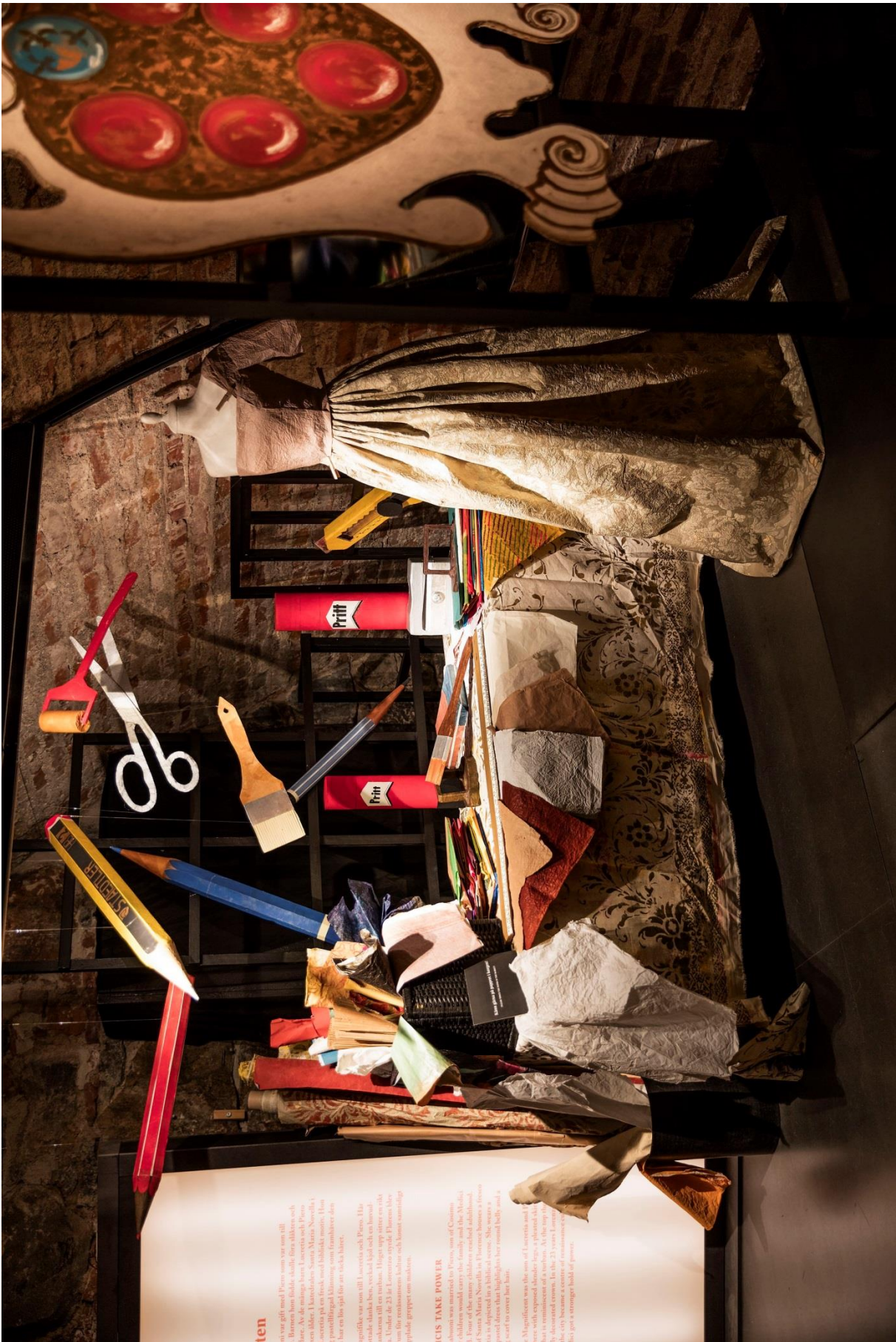
I en känna-på-station kunde besökaren ta på pappret i utställningen