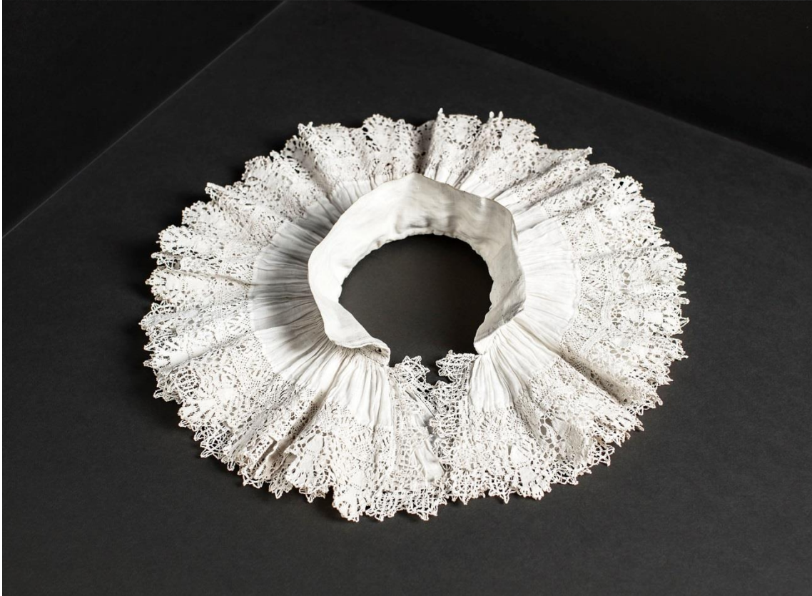
En nygjord papperskrage och en krage från början av 1600-talet