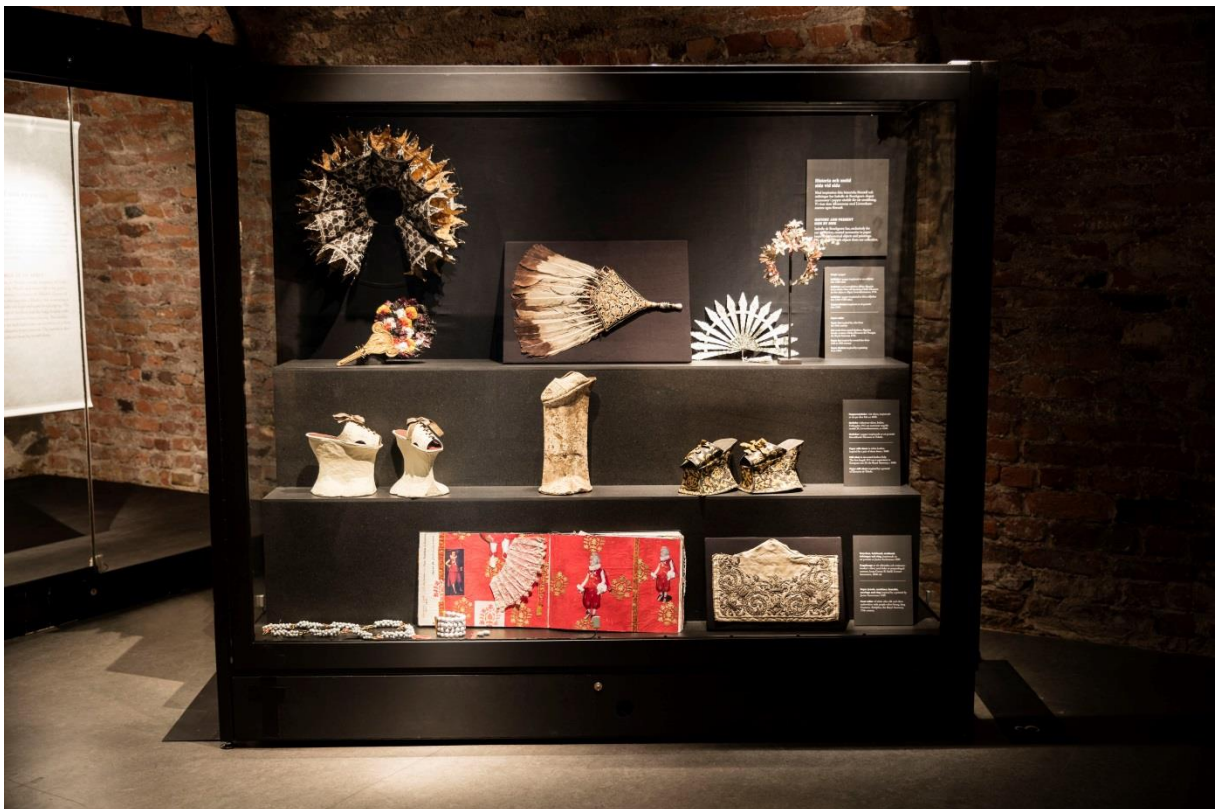
Föremål ur museets samling visades tillsammans med Isabelled de Borchgraves verk i papper