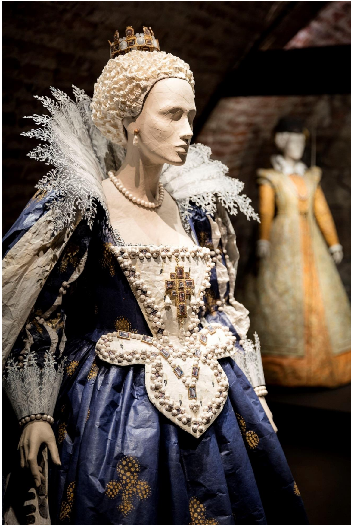
Pappersdräkterna samspelade med slottets källarvalv och Flera dräkter visades fritt i rummet utan monter