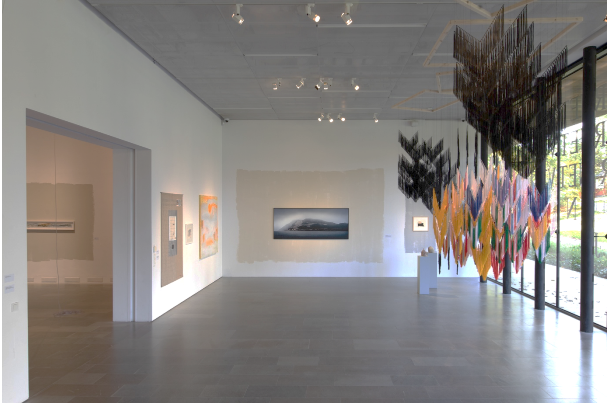
Utställningsvy med Spell on You av Outi Pieski I förgrunden