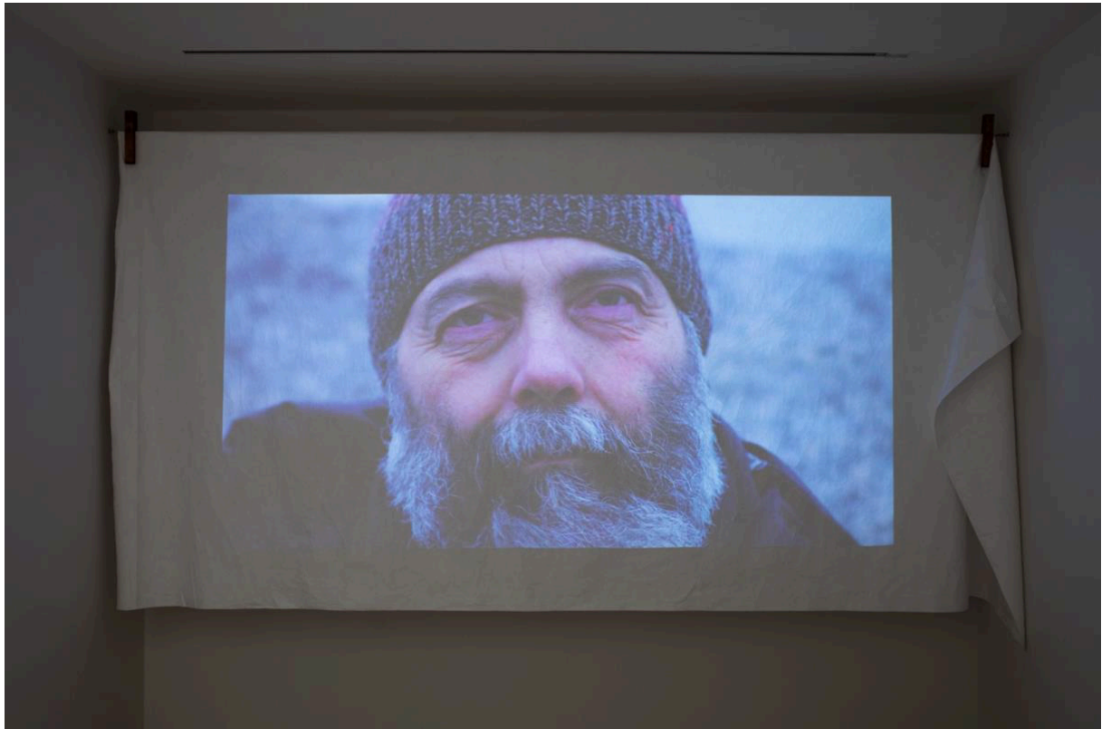
Ett av utställningens videoverk av Geir Tore Holm visas på textil med klämmor.