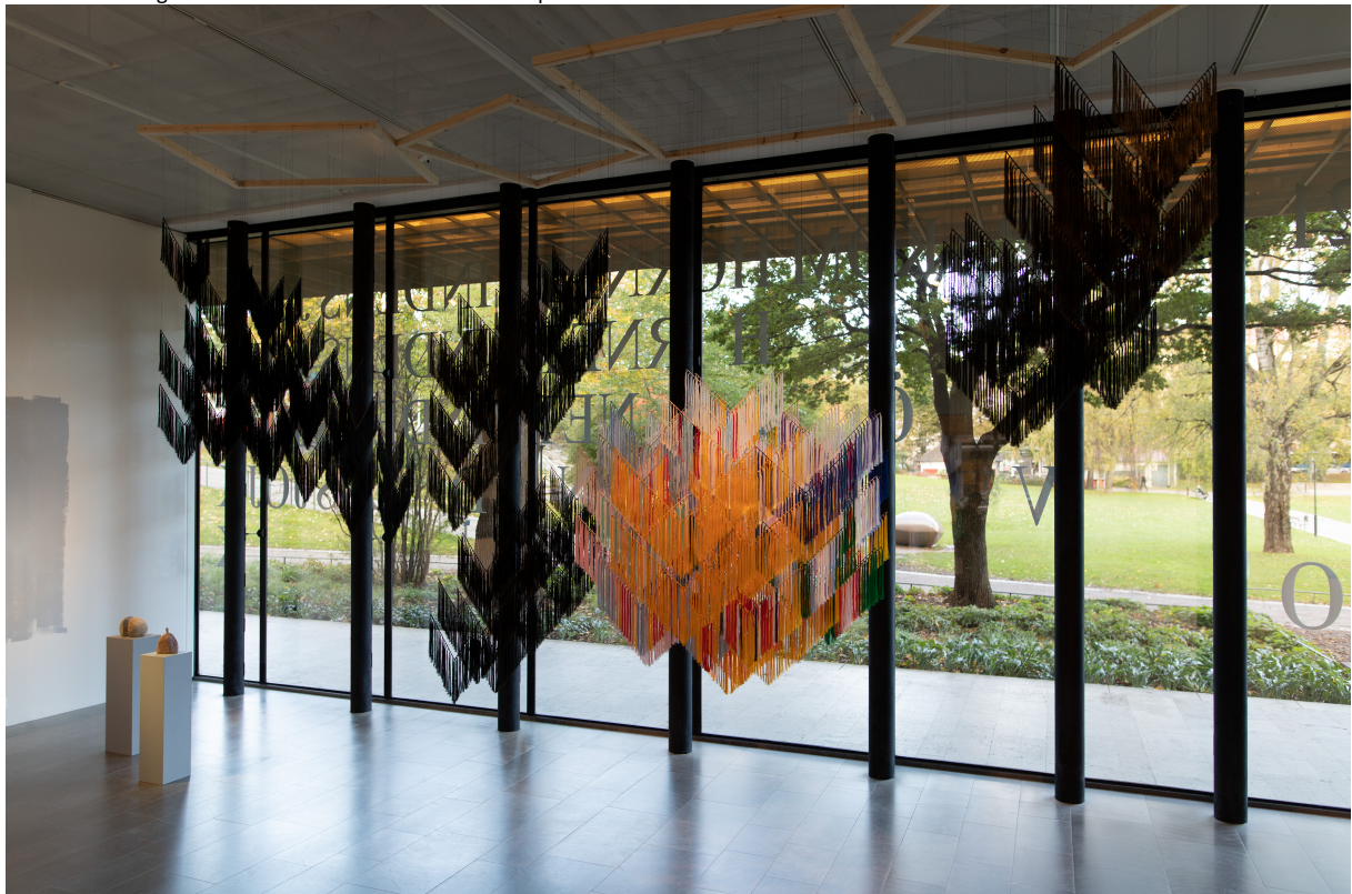
Spell on You , Outi Pieski