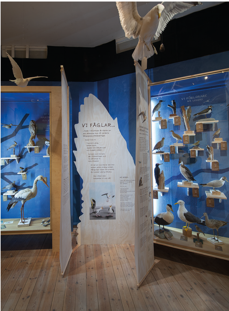
FOLKTRO, POESI och MYTOLOGI