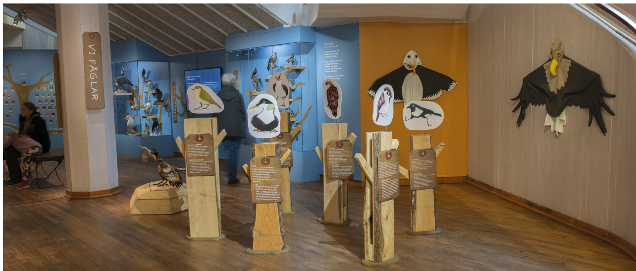
Berättarfågarna i INLEDNINGEN

Strukturen på texterna, med huvudtexter, fördjupningar och lekfulla "fågelprator" låter besökarna följa sin nyfikenhet och hitta information på önskvärd nivå.