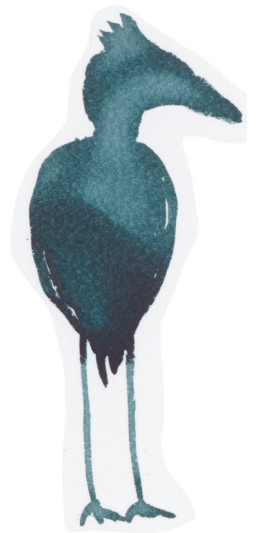
Multiscreenrum FOLKTRO, POESI och MYTOLOGI