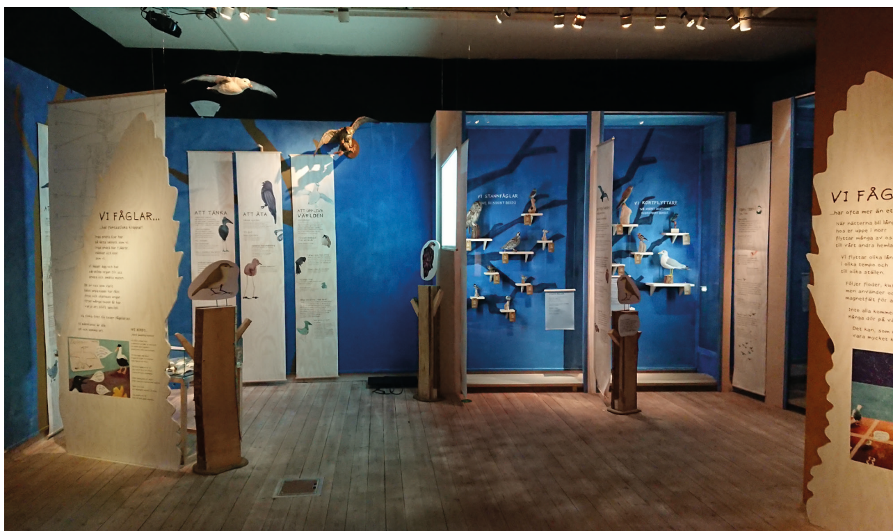
VÅRA EGENSKAPER och FLYTTFÅGLAR