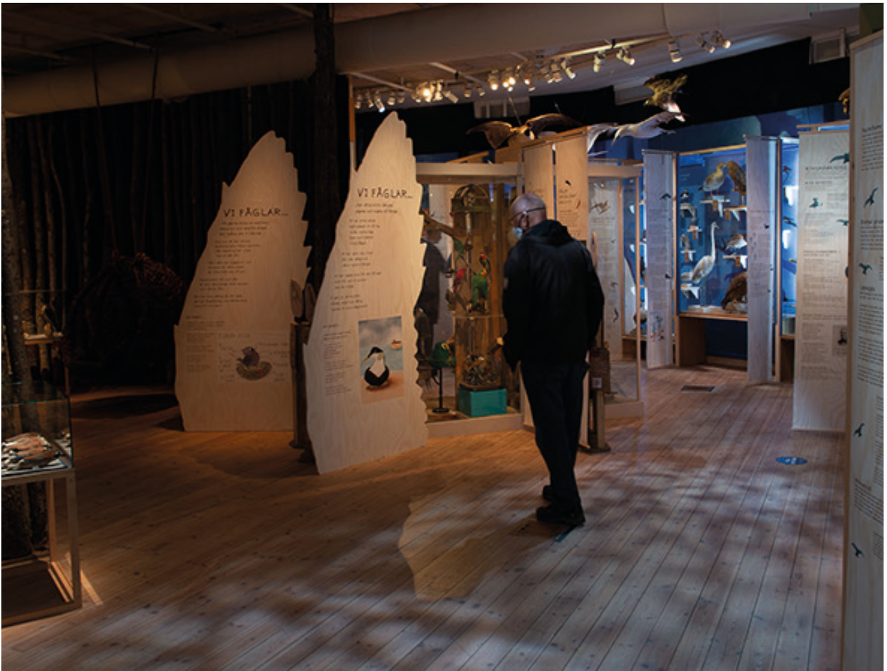
TORGET mellan delarna