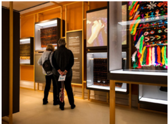
MAGISKA MÖNSTER - UTSTÄLLNINGSMILJÖ & WORKSHOP