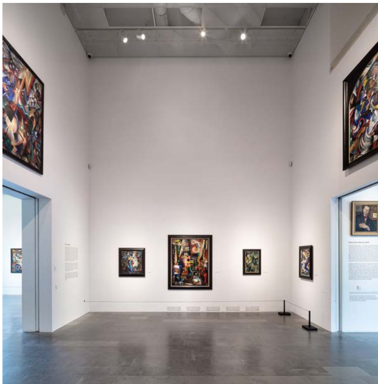
Matrosmotiv i första utställningshallen.