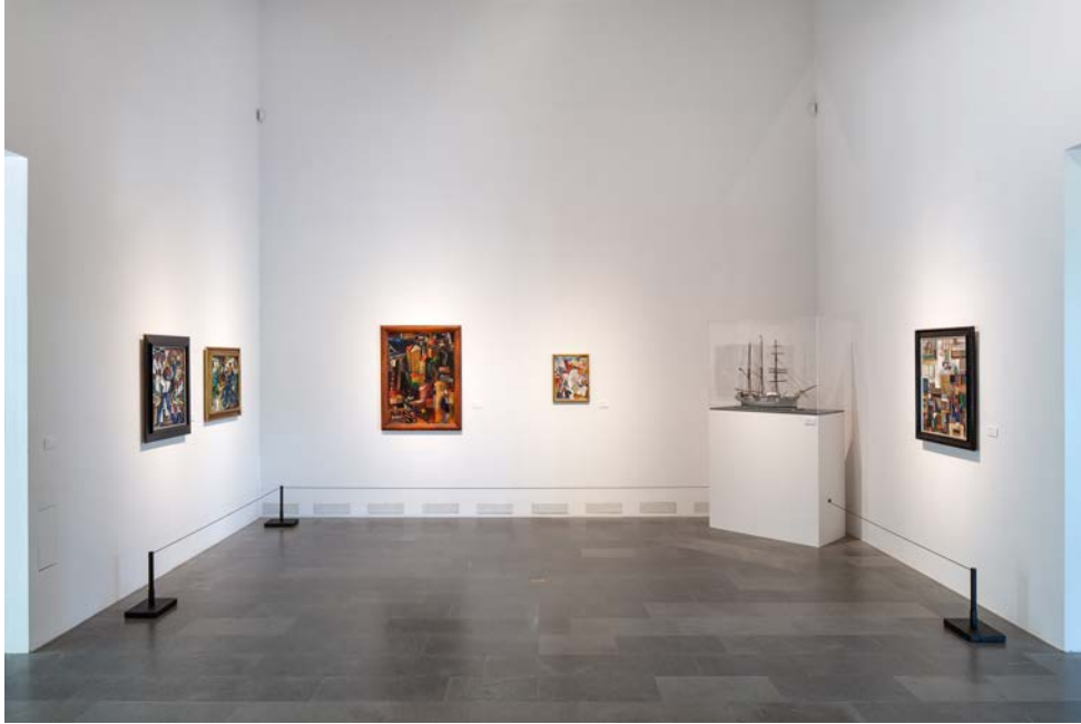
Matrosmotiv i första utställningshallen.