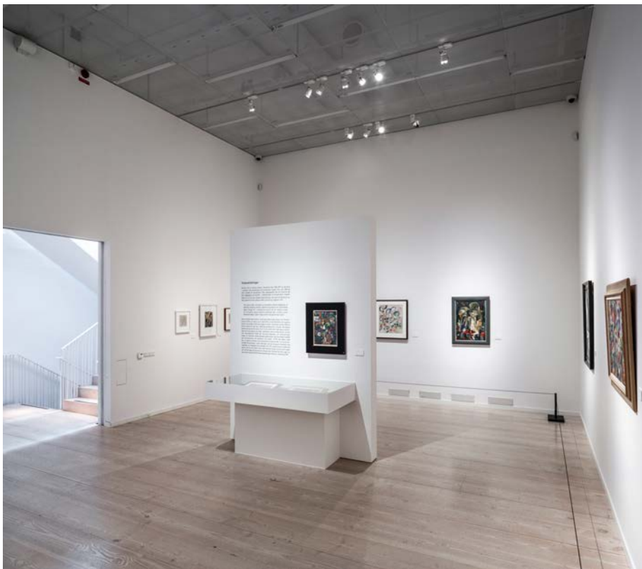
Storstadsmotiv på 4.