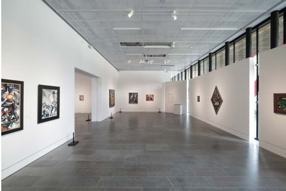
10 av 17 verk som gick att spåra från utställningen på Gummesons 1918 i den stora konsthallen.