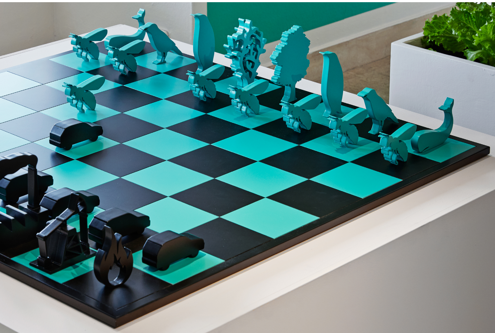
Schackspelet "Människan mot biosfären"