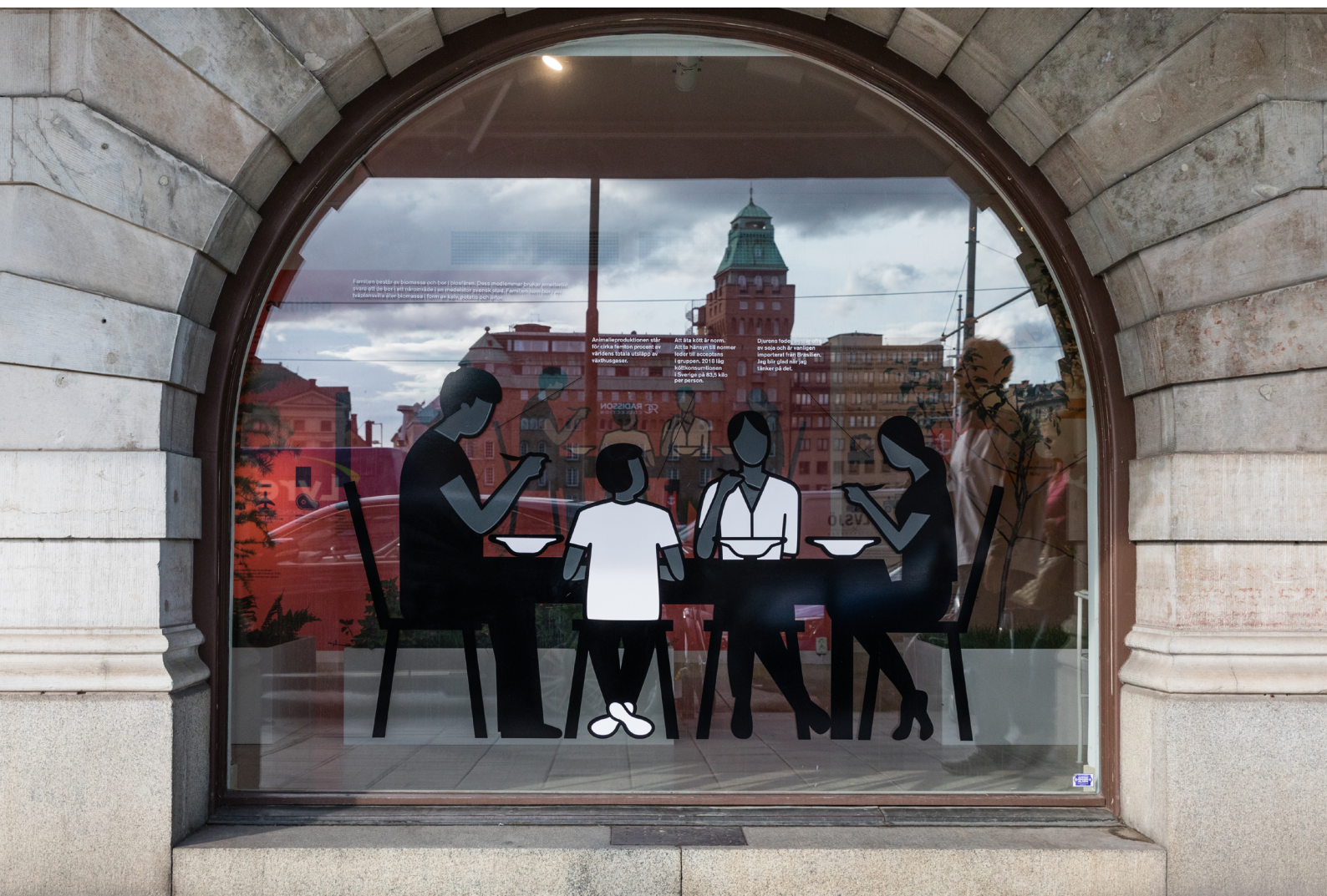
En av fyra fönstervinylter

Famnan består av barn och vuxna och är i biosfären. Dessa medlemmar dröjer om miljön... svare get de bor i ett värdnadslokal i en produktionsplats (stad) i familjen och de medlemmar i biosfären är i biosfären i form av produktionsplatsen.