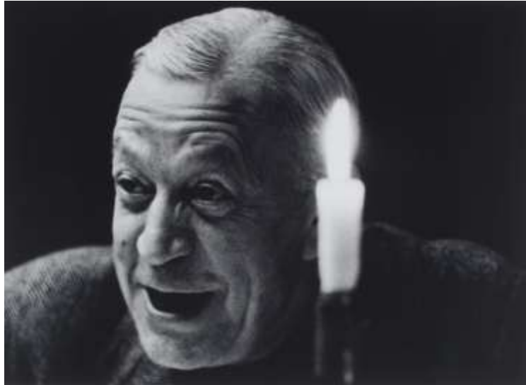
Fritiof Nilsson Piraten