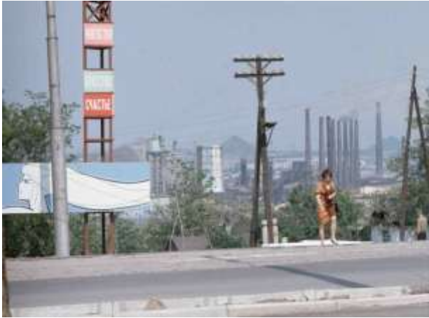
11. Donetsk, Ukraina