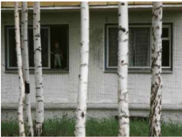
54. Novosibirsk, Sibirien