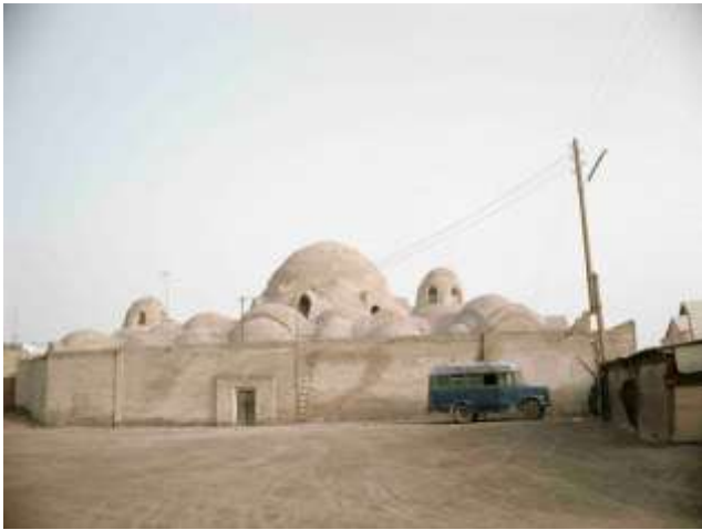
50. Buchara, Uzbekistan