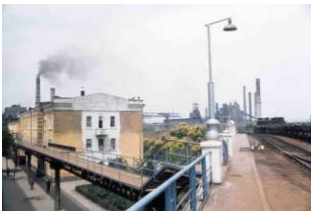
28. Platsangivelse saknas