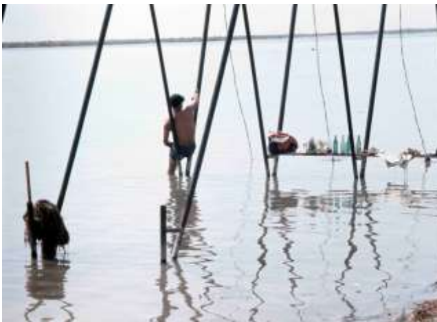
46. Karakum, Turkmenistan