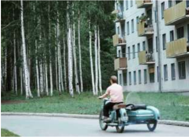
53. Novosibirsk, Sibirien