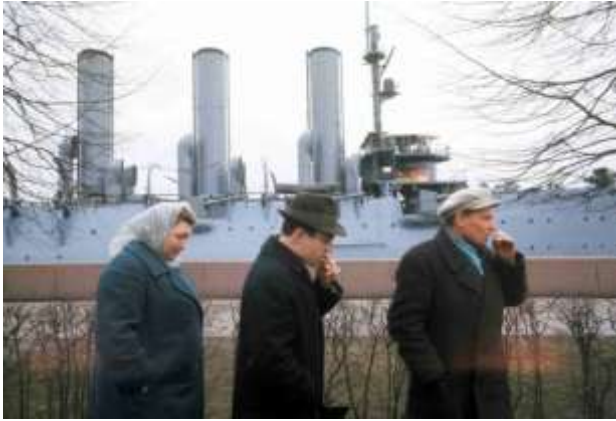
29. Pansarkrysaren Aurora, Leningrad