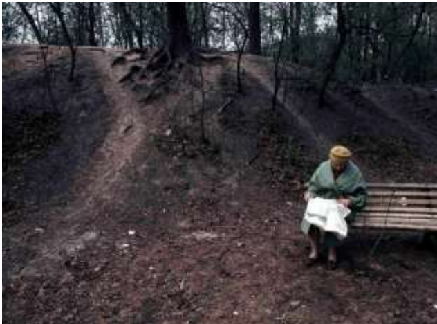
45. Platsangivelse saknas