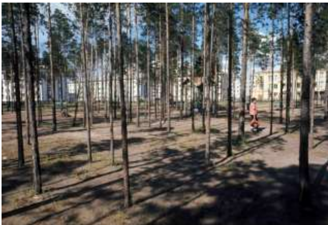
37. Platsangivelse saknas