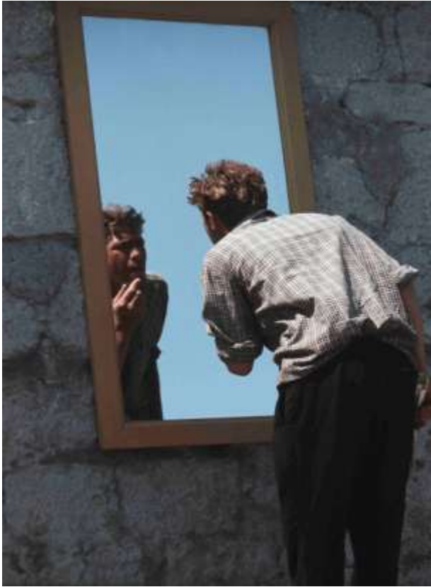
9. Jalta, Ukraina