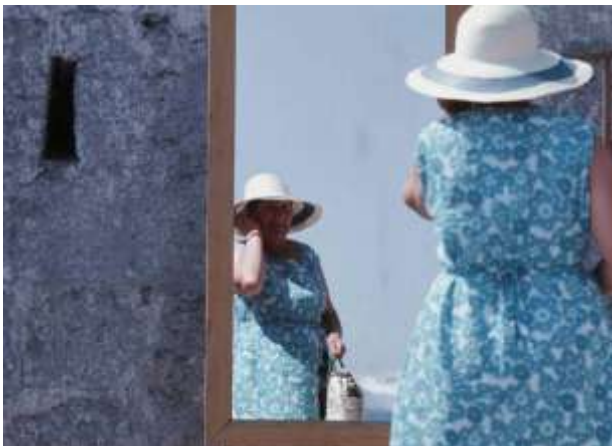
8. Jalta, Ukraina