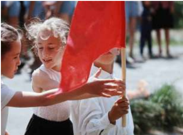
52. Khabarovsk, sydöstra Sibirien