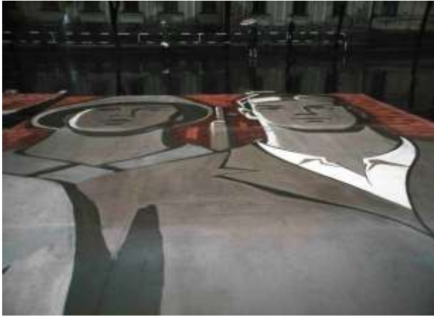
14. Kiev, Ukraina