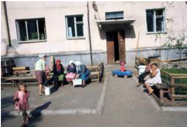
36. Bratsk, södra Sibirien