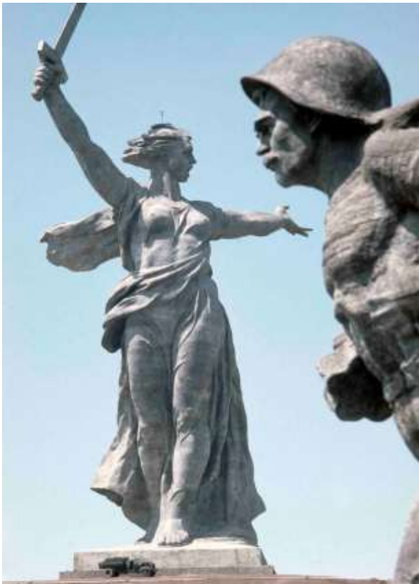
19. Moder Ryssland, Volgograd