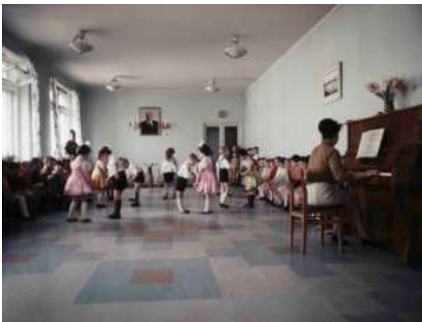
12. Odessa, Ukraina