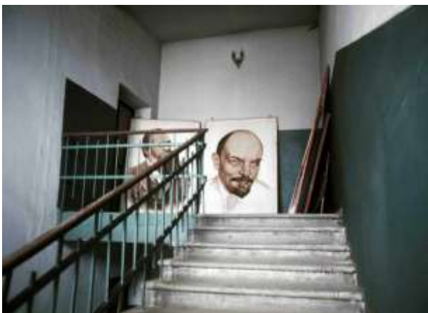
13. Odessa, Ukraina