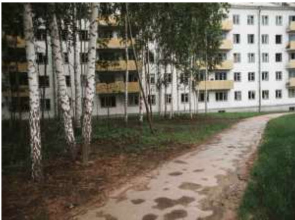
2. Novosibirsk, Sibirien