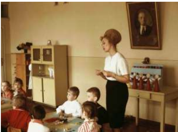
33. Minsk, Vitryssland