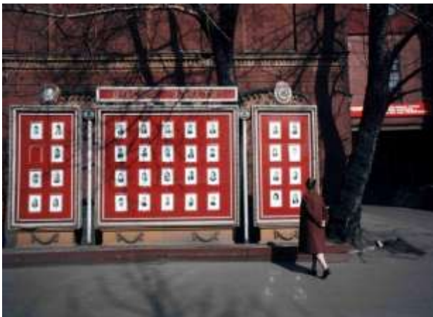
31. Arbetets hjältar