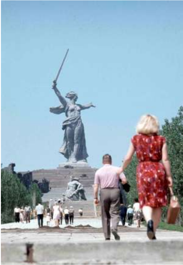
20. Moder Ryssland, Volgograd