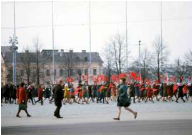
56. Platsangivelse saknas