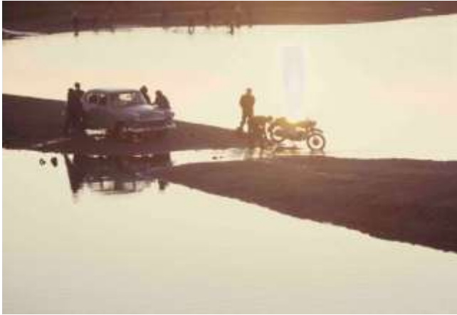
38. Platsangivelse saknas