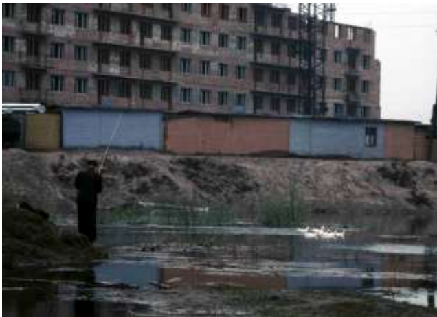
42. Platsangivelse saknas