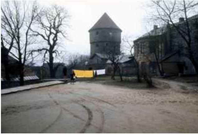
41. Platsangivelse saknas