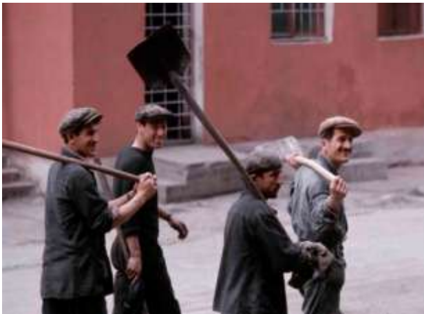
27. Rustavi, Georgien