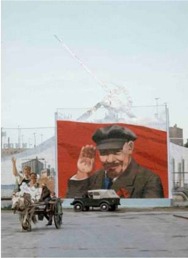
51. Buchara, Uzbekistan