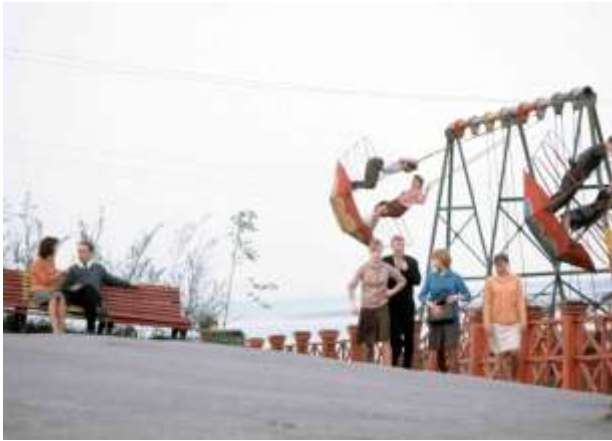
18. Platsangivelse saknas