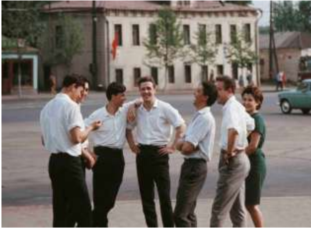
49. Platsangivelse saknas