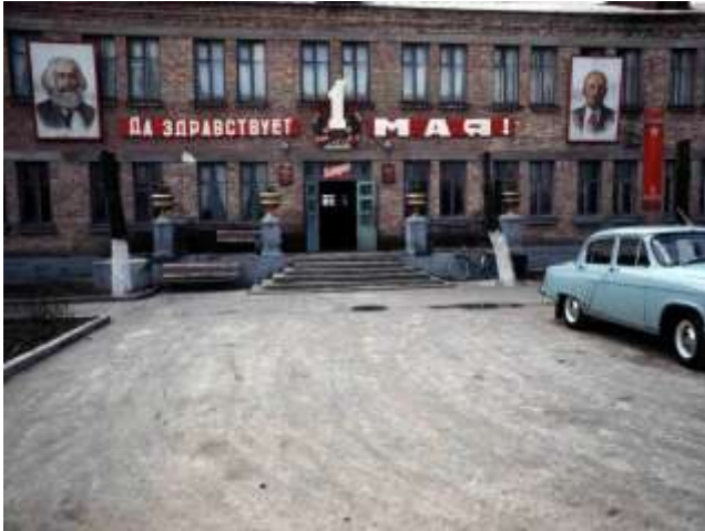
44. Välkommen 1 maj