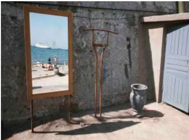
10. Jalta, Ukraina