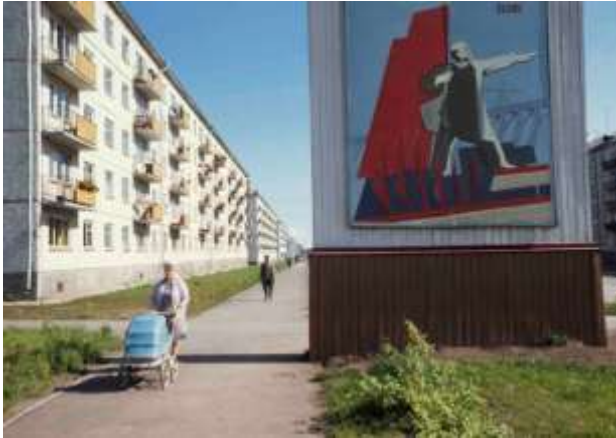
32. Bratsk, södra Sibirien