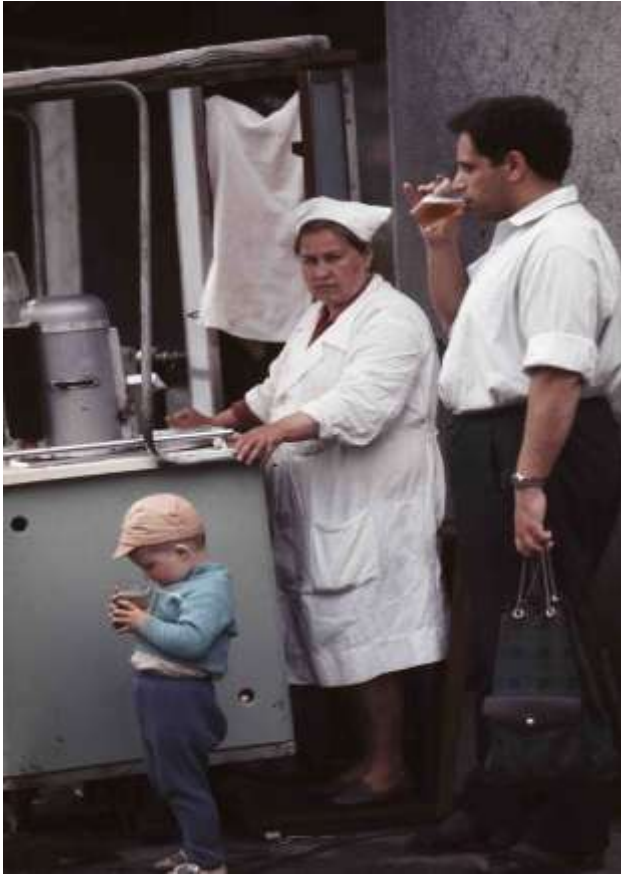
55. Novosibirsk, Sibirien