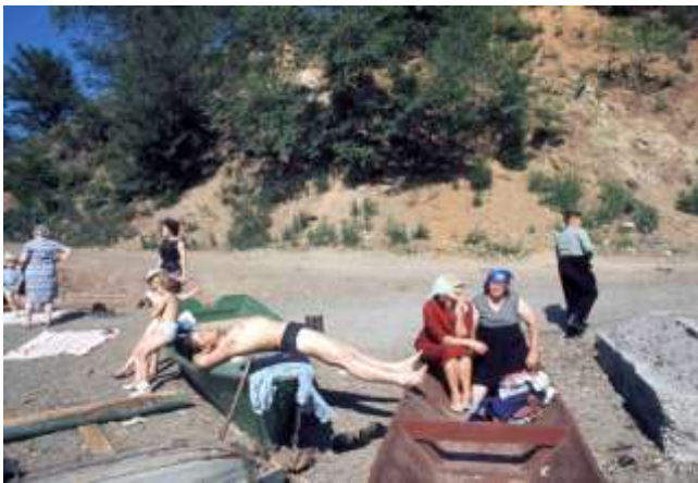
39. Platsangivelse saknas