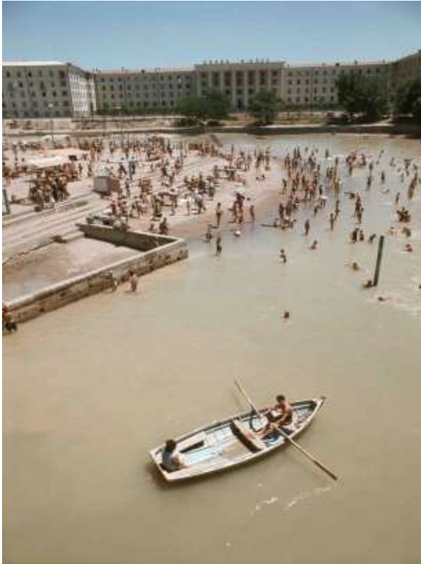
7. Tasjkent, Uzbekistan