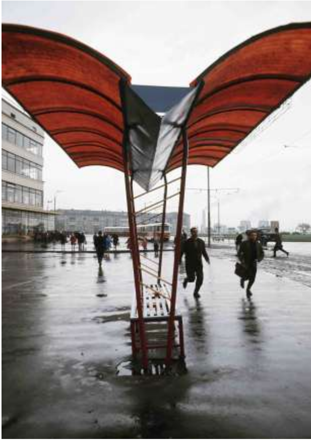
16. Minsk, Vitryssland