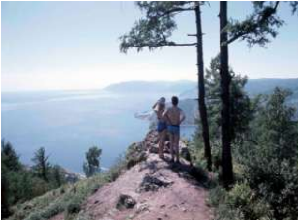
26. Bajkalsjön, södra Sibirien