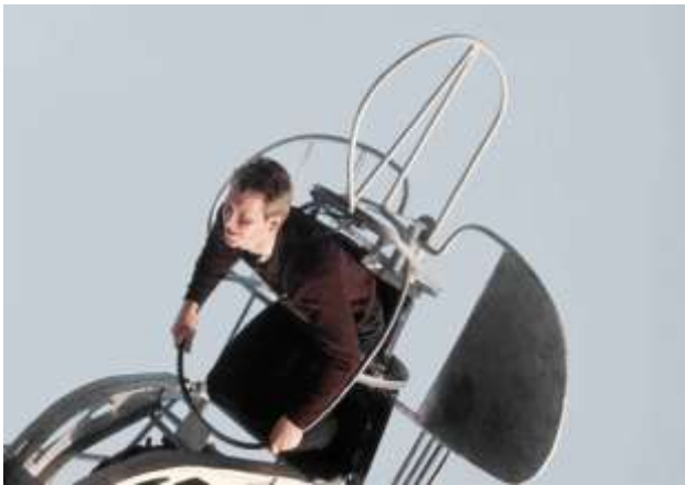
15. Kiev, Ukraina