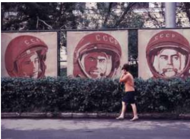
30. Platsangivelse saknas