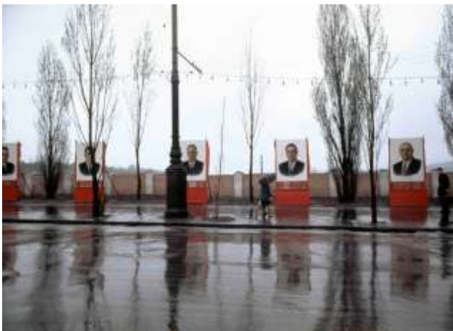
43. platsangivelse saknas