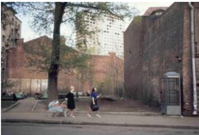
40. platsangivelse saknas