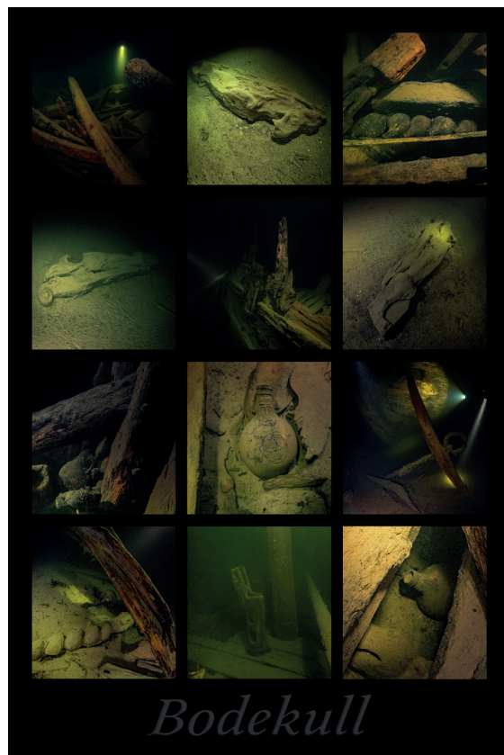
Poster med bilder från vraket efter fregatten Bodekull, ett av världens bäst bevarade vrak från 1600-talet.

ÖSTERSJÖN - en kulturskatt är producerad av Kultur Vallentuna och går att boka fr o m sommaren 2019. Östersjön - en kulturskatt är en fristående del av vandringsutställningen Under ytan - en fotografisk djupdykning.